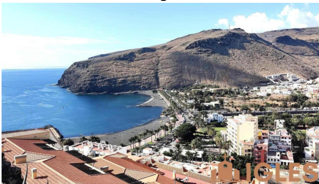
San sebastian de la gomera san sebastian de la gomera