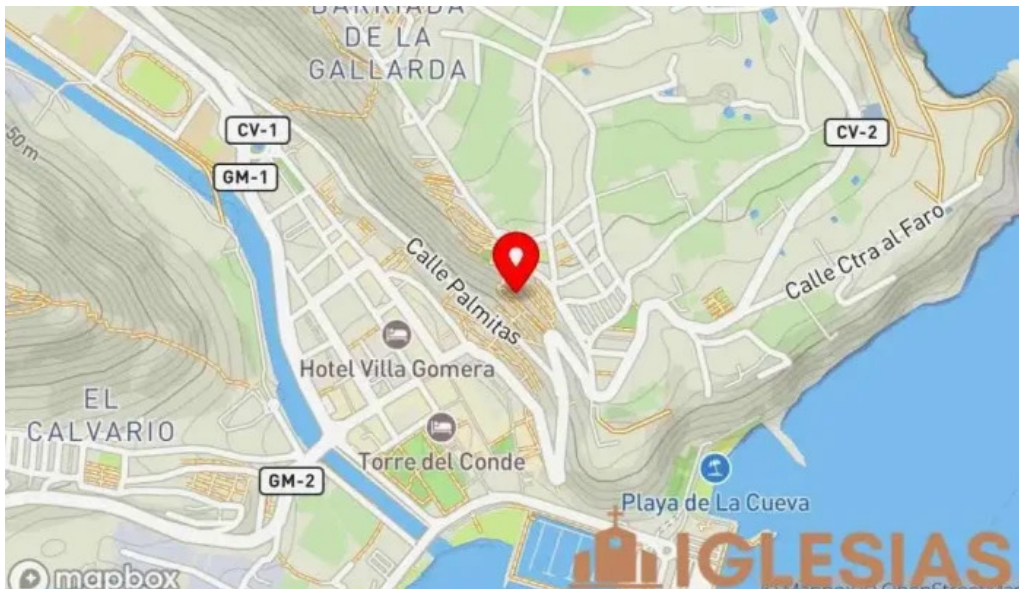
San sebastian de la gomera mapa