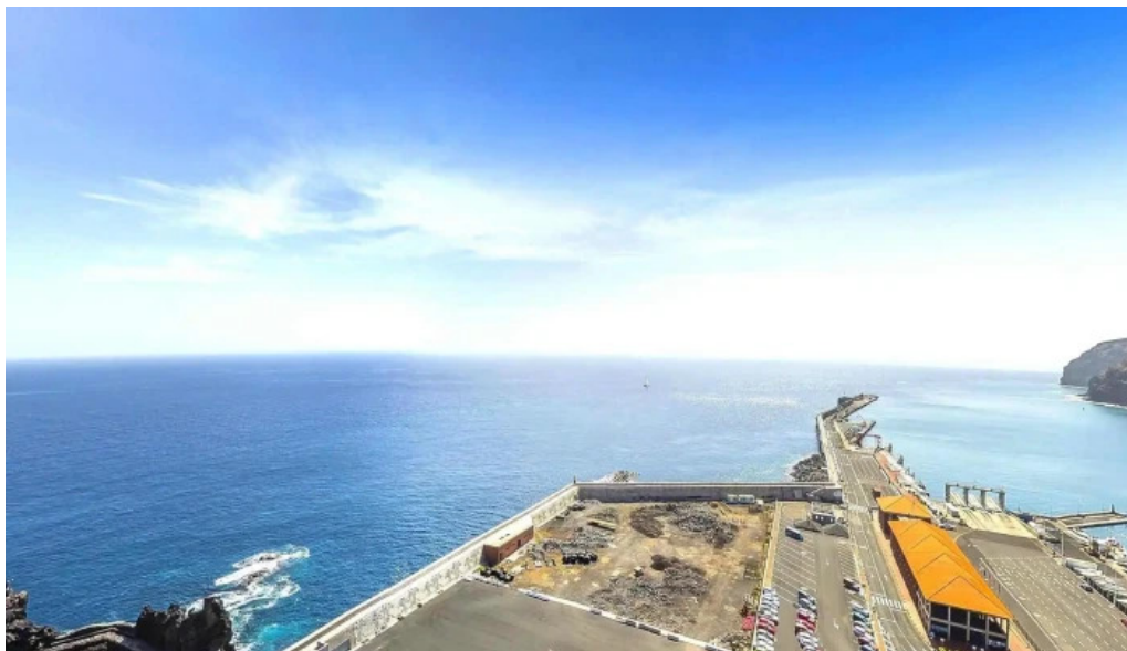
San sebastian de la gomera instagram