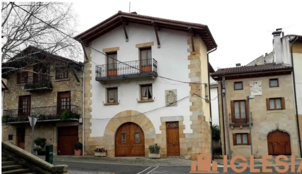
C de la iglesia olazagutia