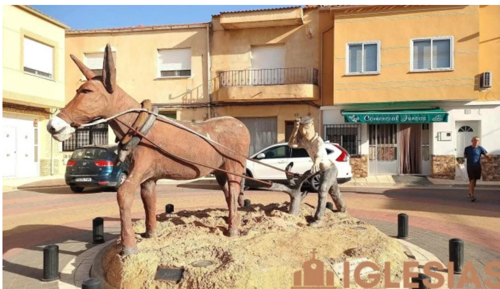
Navas de jorquera iglesias