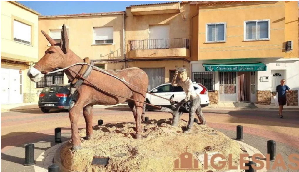
Navas de jorquera navas de jorquera