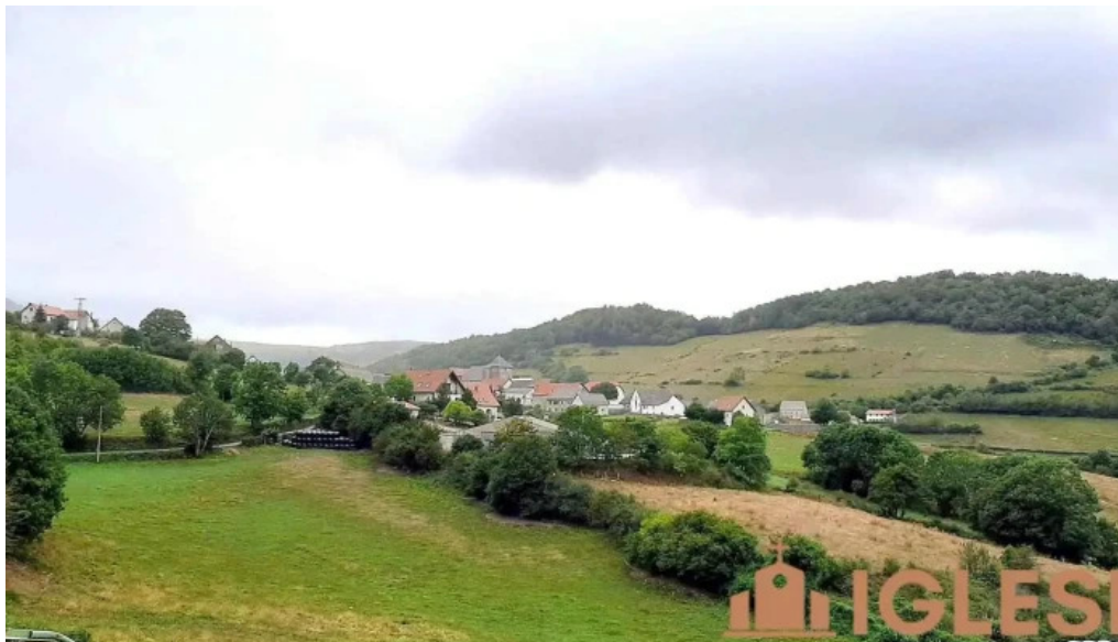
Hiriberri villanueva de aezkoa navarra