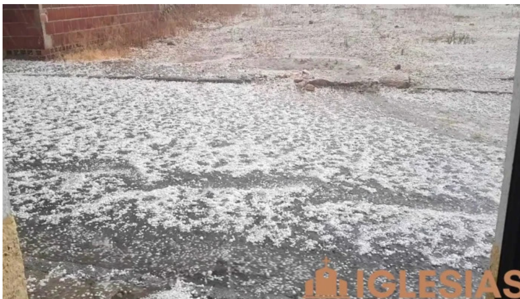
Mancera de arriba iglesias