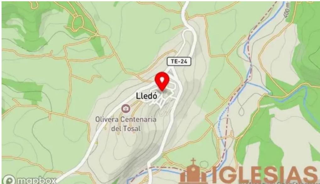
Calle iglesia lledo