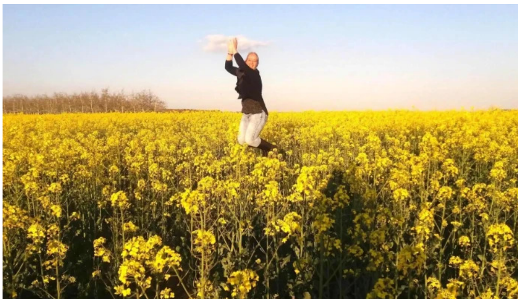
Gimenells y el placita de la font gimenells