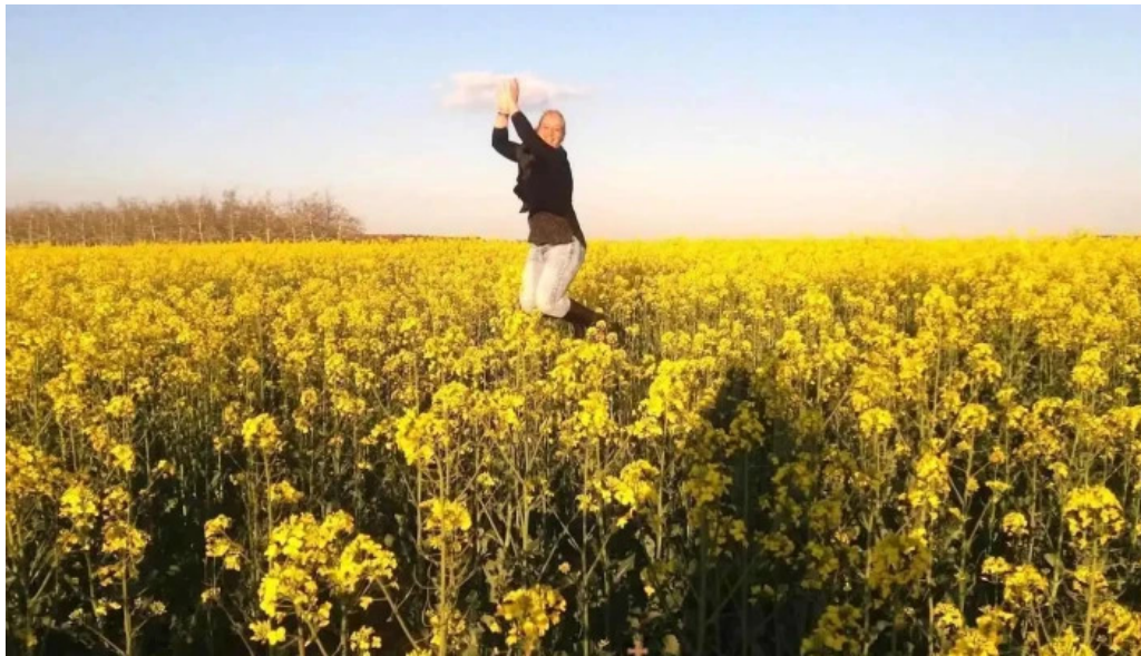
Gimenells y el placita de la font lerida