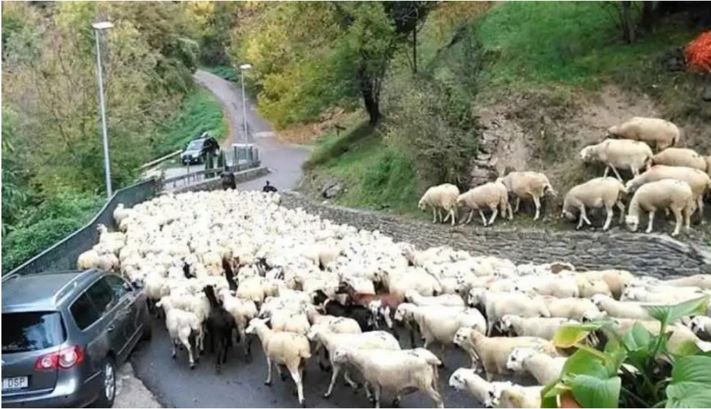
Las iglesias las iglesias