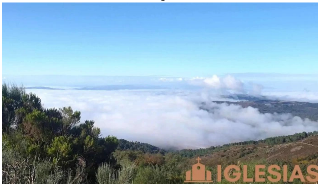
Junquera de espadanedo montana