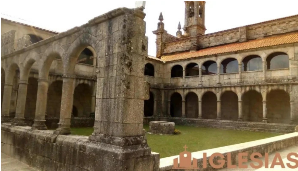
Junquera de espadanedo junquera de espadanedo