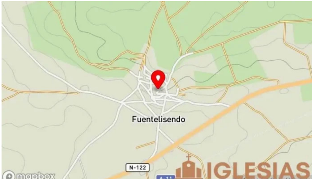
C la iglesia fuentelisendo