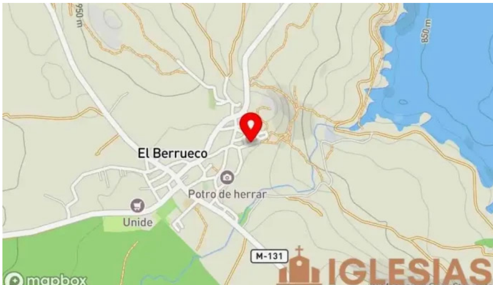
C de la iglesia el berrueco