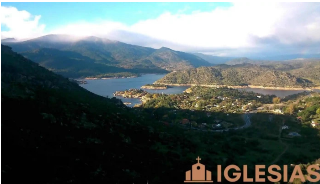
El barraco el barraco