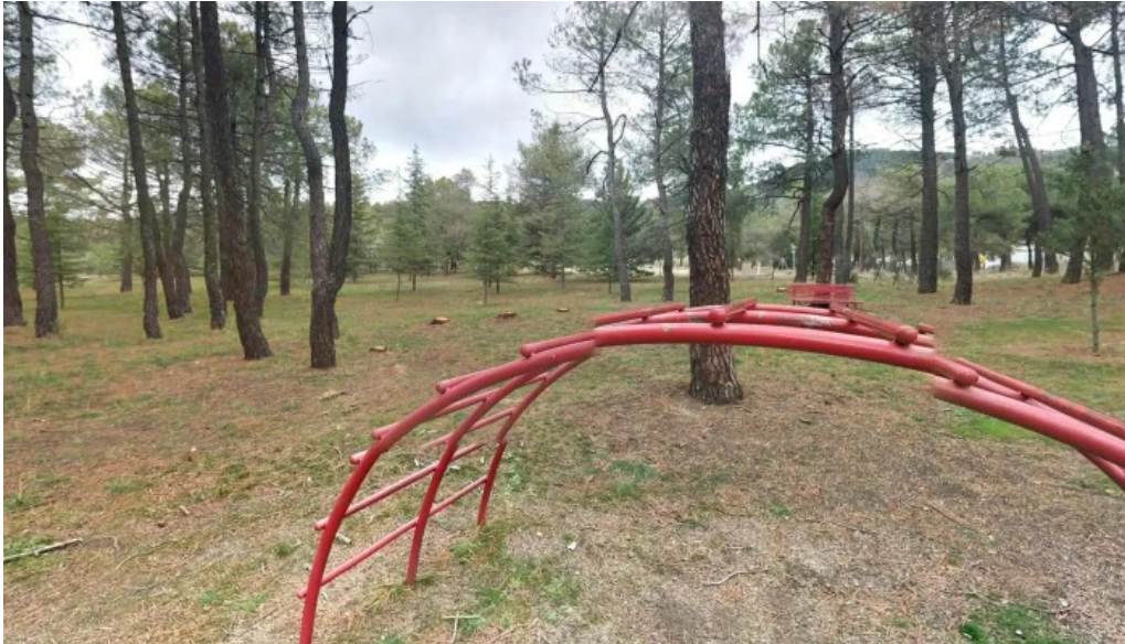
El barraco barraco