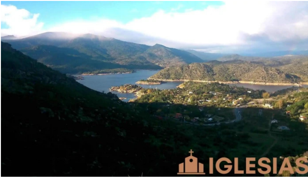
El barraco iglesia