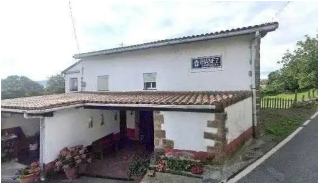
Bianez carranza sitio web