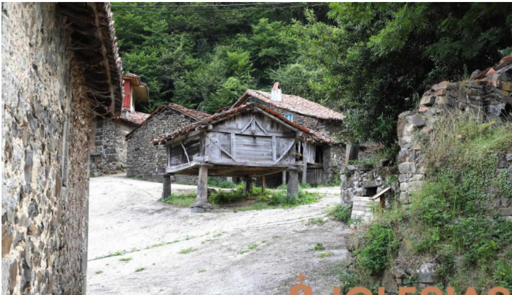
Horreos beyuscos de viboli iglesias