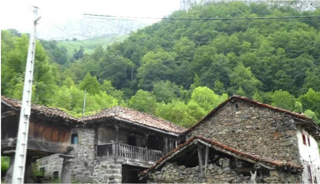
Horreos beyuscos de viboli asturias