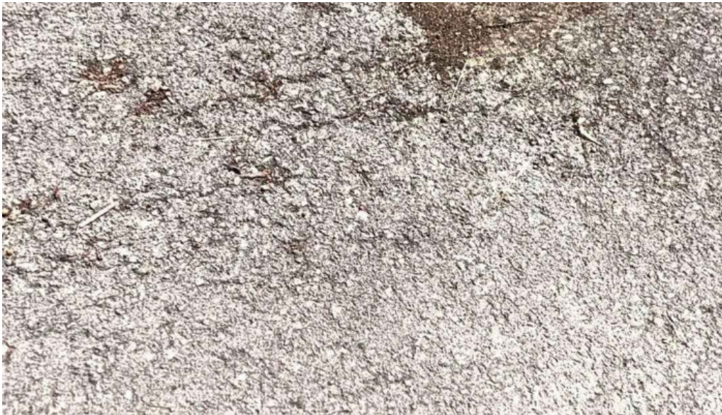
Horreos beyuscos de viboli videos