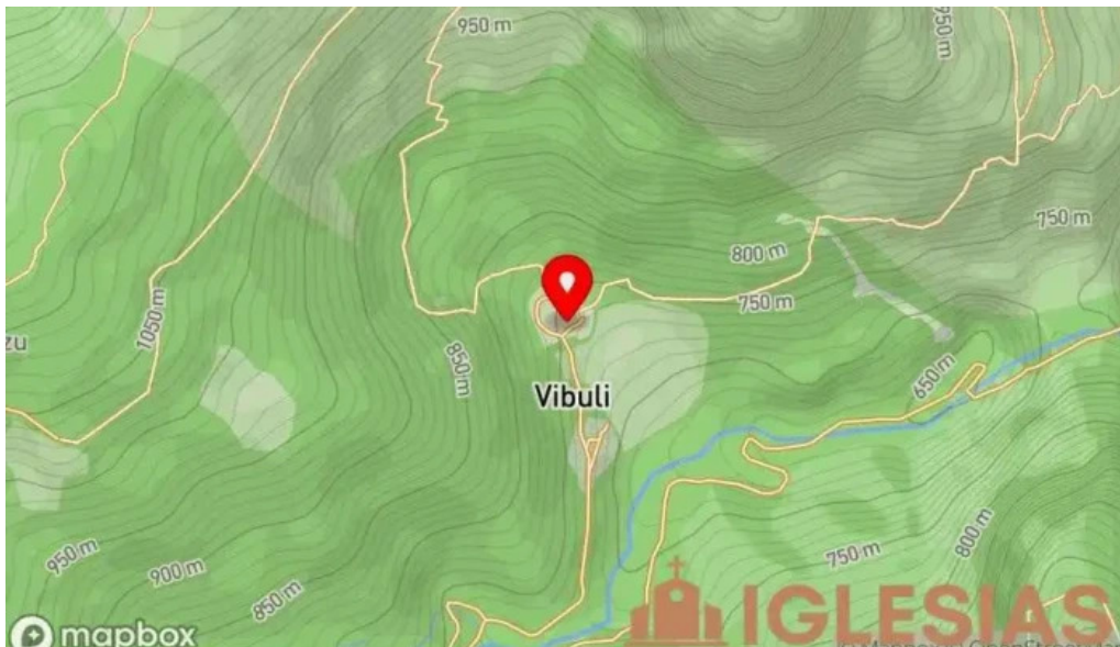
Horreos beyuscos de viboli mapa