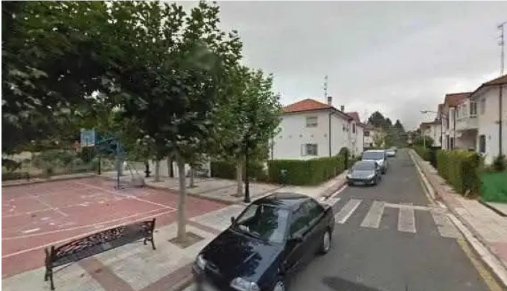
Capilla zubillaga iglesia