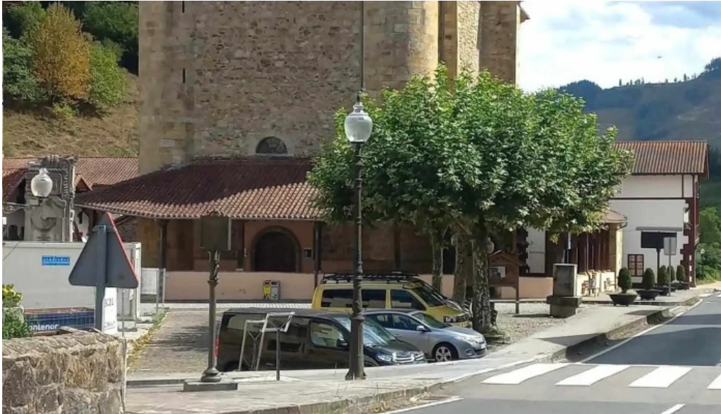
Iglesia de santo tomas iglesia