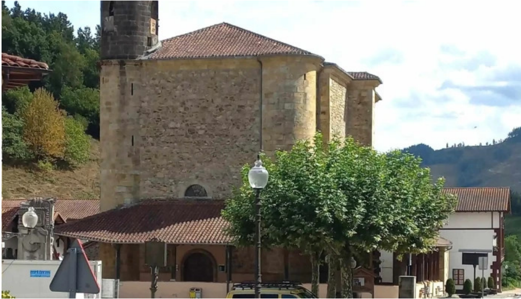
Iglesia de santo tomas ziertza bolibar