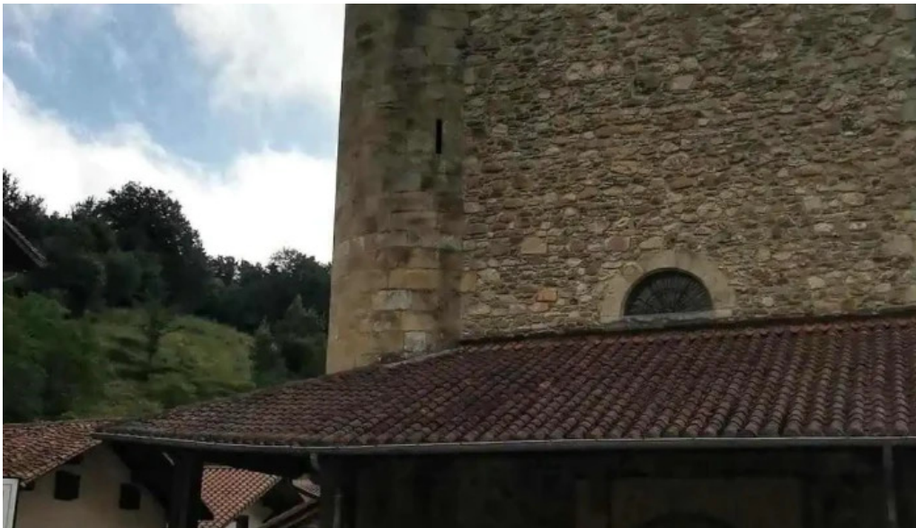
Iglesia de santo tomas videos