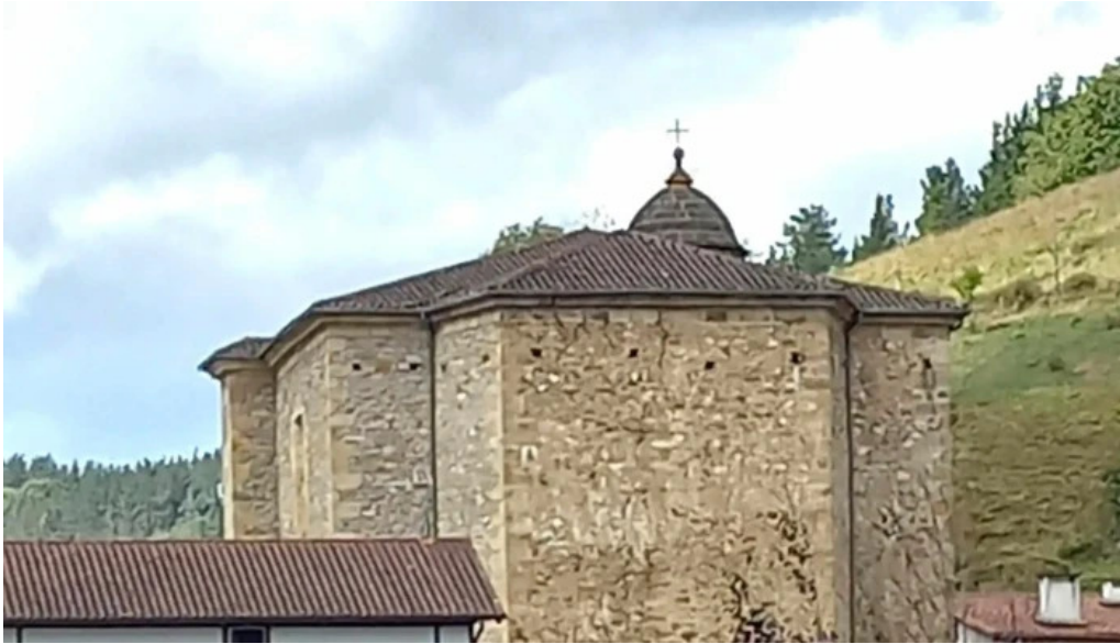
Iglesia de santo tomas precios