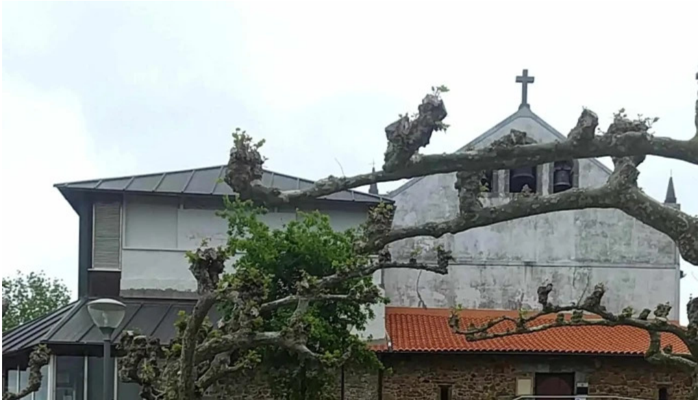
Iglesia de san pedro ad vincula opiniones