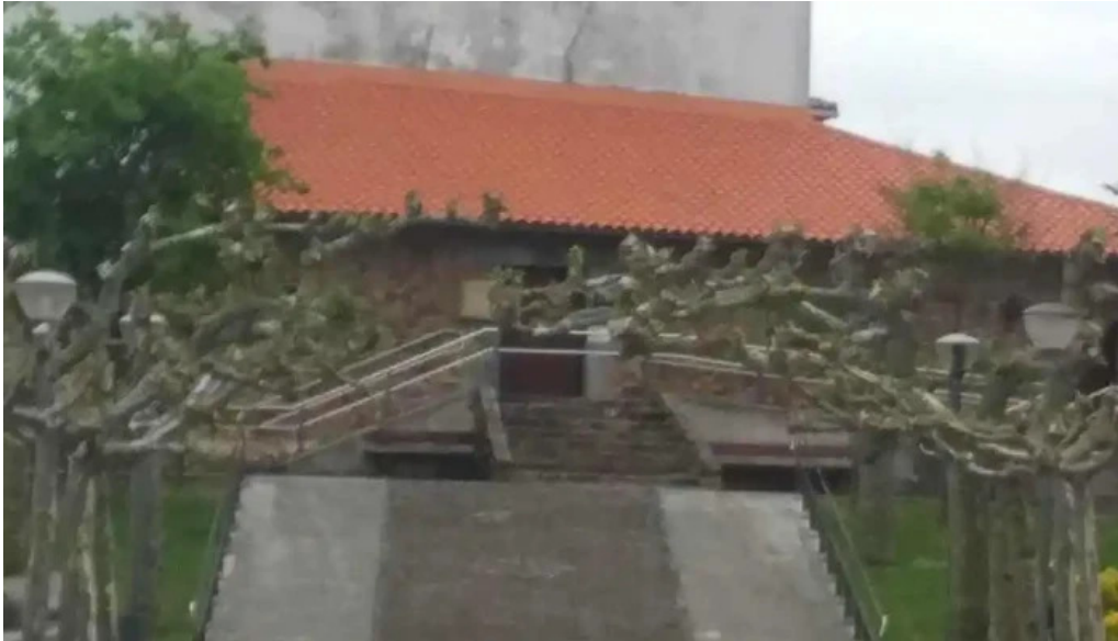
Iglesia de san pedro ad vincula iglesia