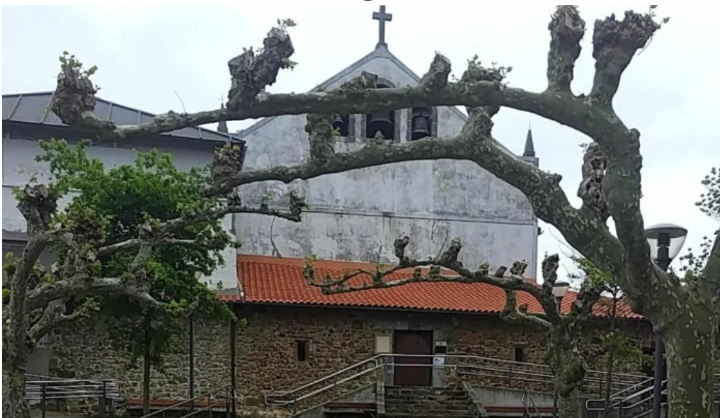
Iglesia de san pedro ad vincula zelaia