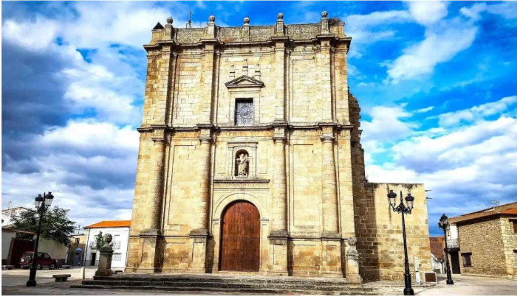
Iglesia de san andres apostol iglesia