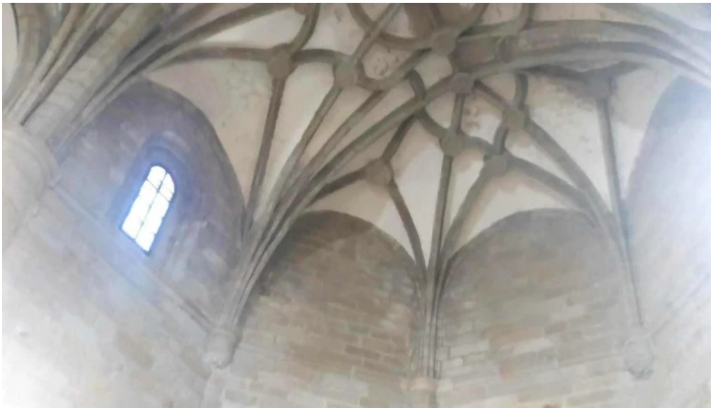
Iglesia de san andres apostol videos