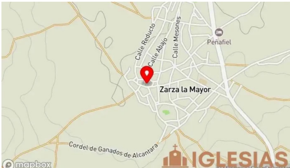
Iglesia de san andres apostol mapa