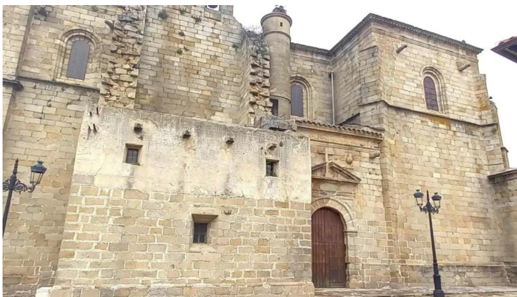
Iglesia de san andres apostol cerca de mi