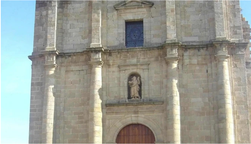
Iglesia de san andres apostol zarza la mayor