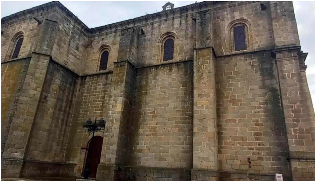
Iglesia de san andres apostol fotos