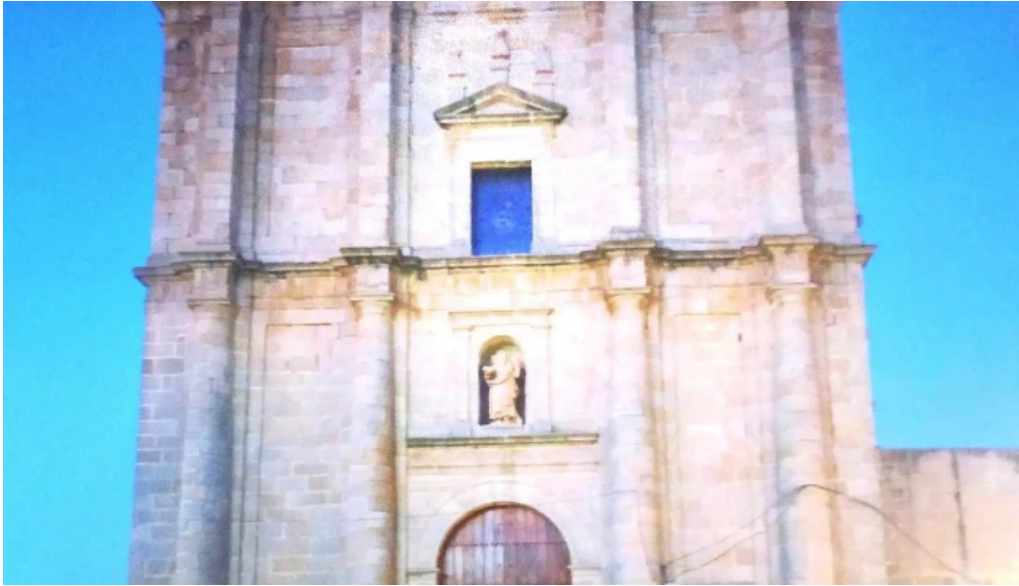
Iglesia de san andres apostol promocion