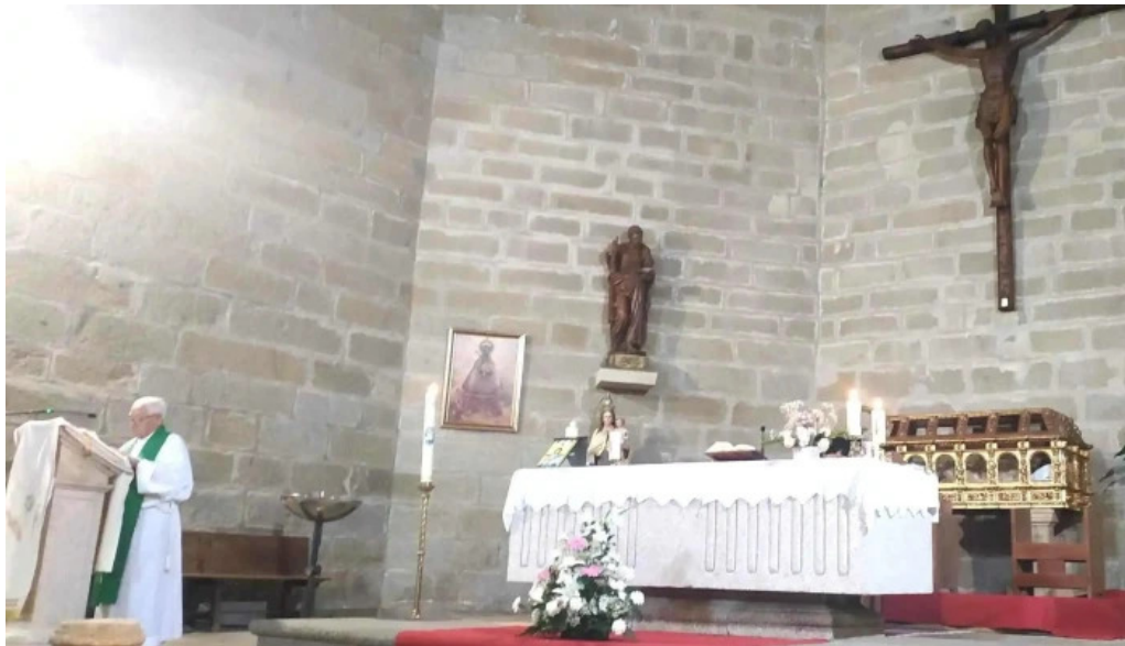
Iglesia de san andres apostol ubicacion