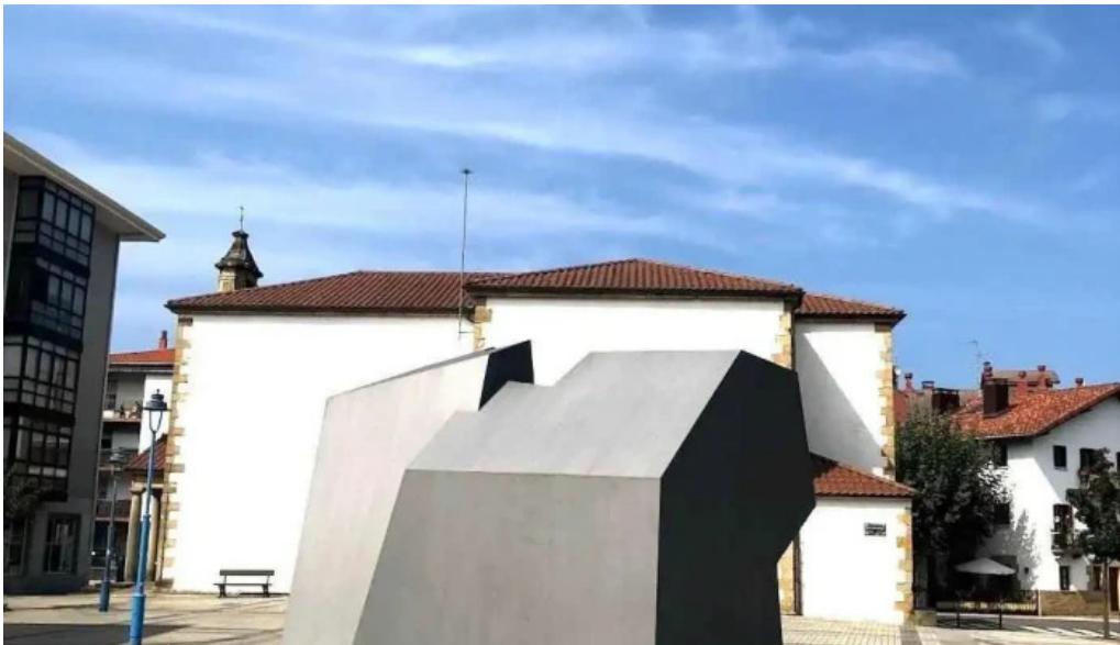
Ermita san pelaio zarautz