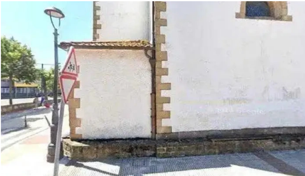
Ermita san pelaio fotos