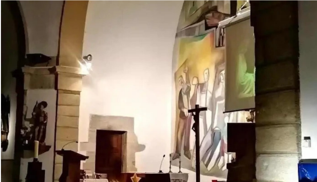
Ermita san pelaio iglesia