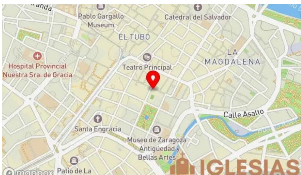
Capilla de adoracion del monasterio de santa catalina clarisas mapa