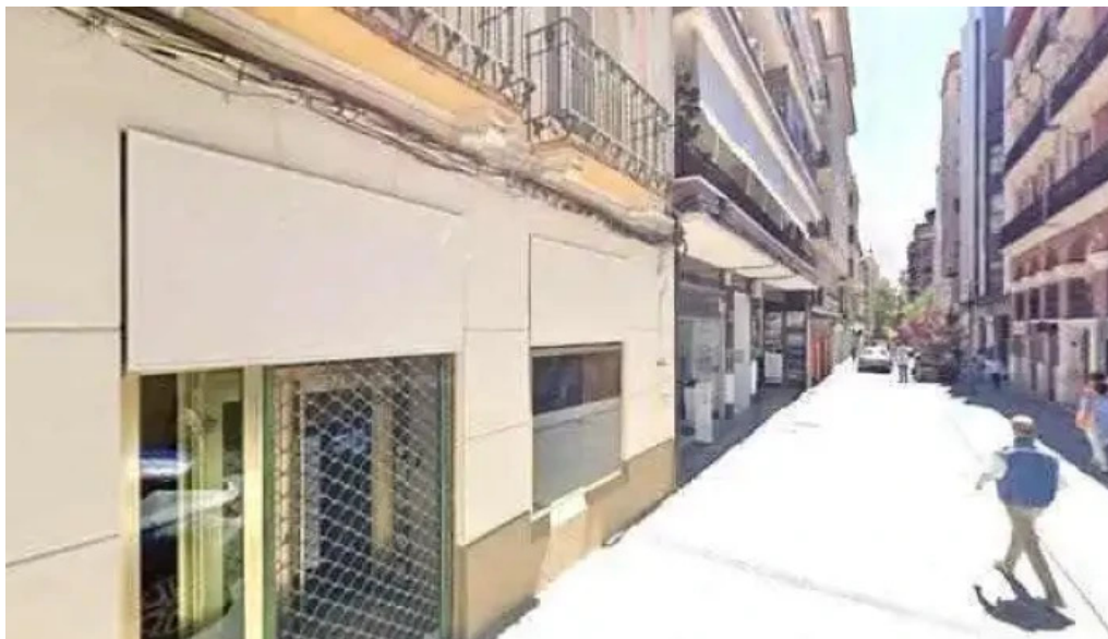
Capilla de adoracion del monasterio de santa catalina clarisas iglesia