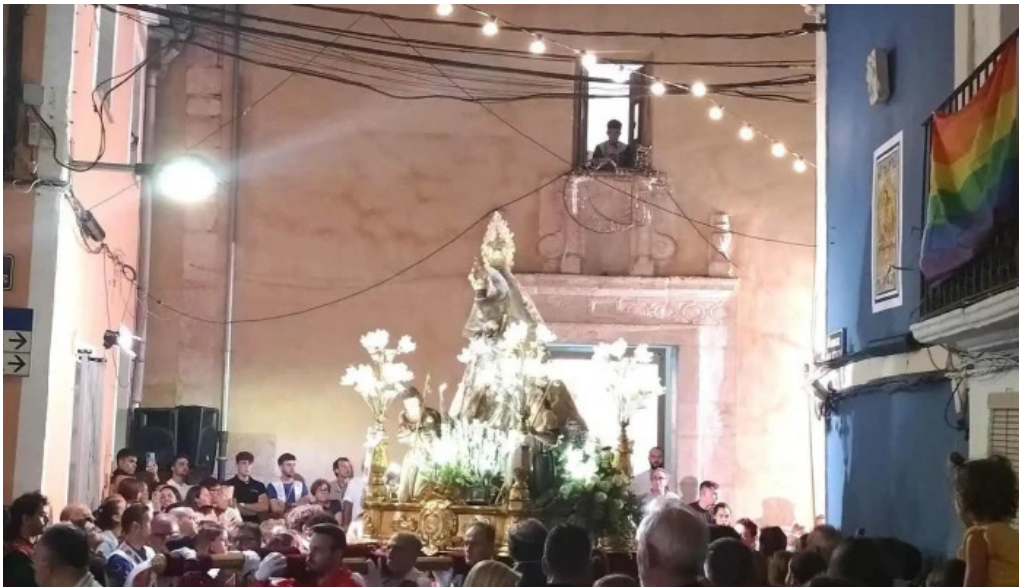
Ermita de san jose iglesia