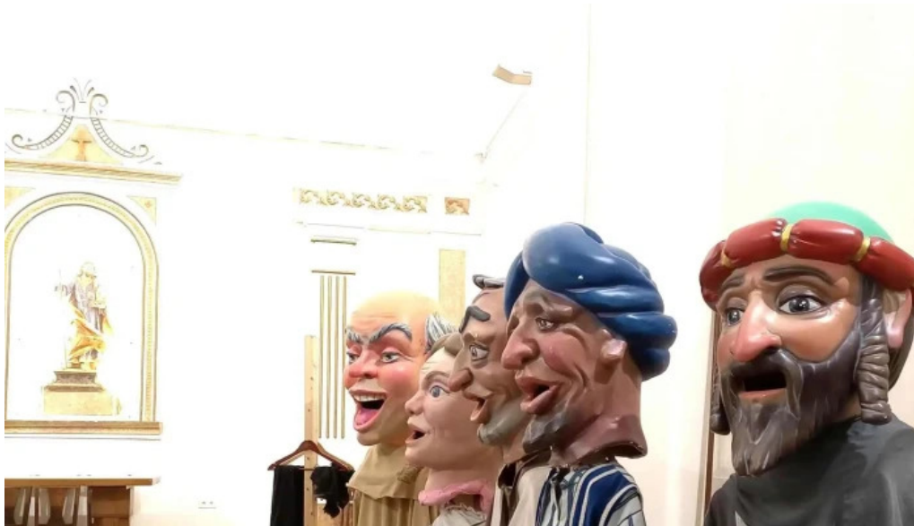
Ermita de san jose comentario 1