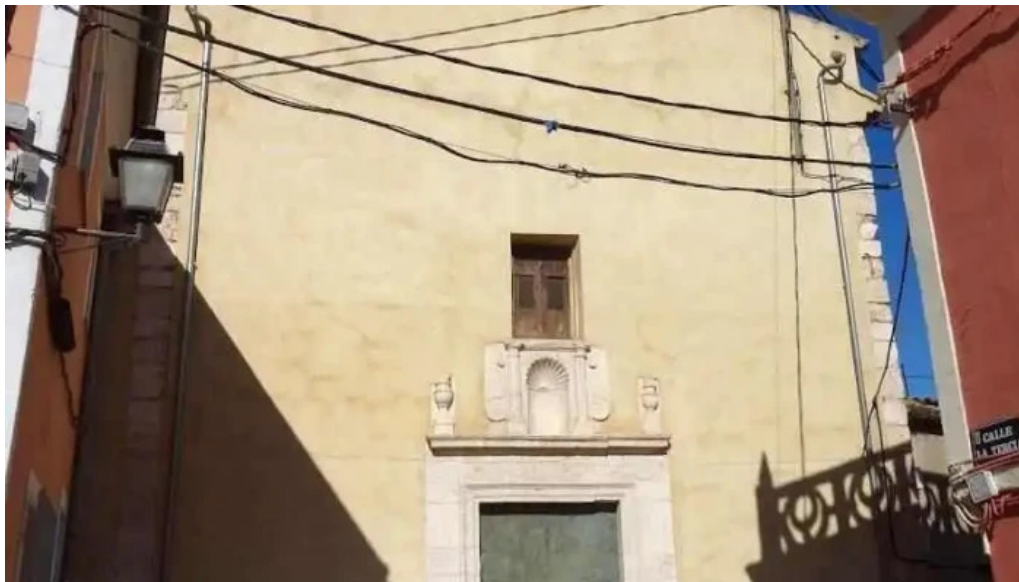
Ermita de san jose villena