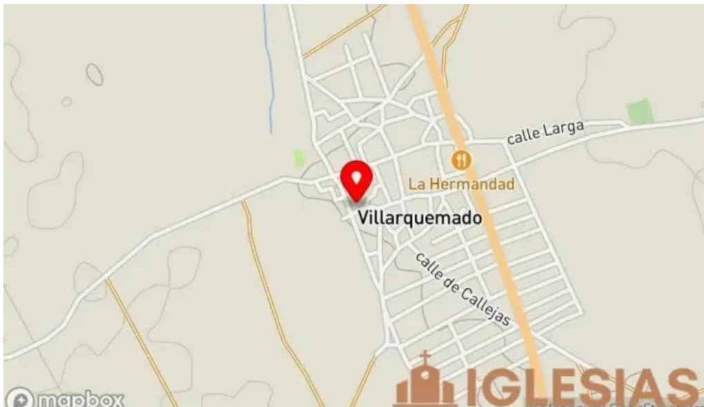
Iglesia parroquial de nuestra señora de la asuncion de villarquemado mapa