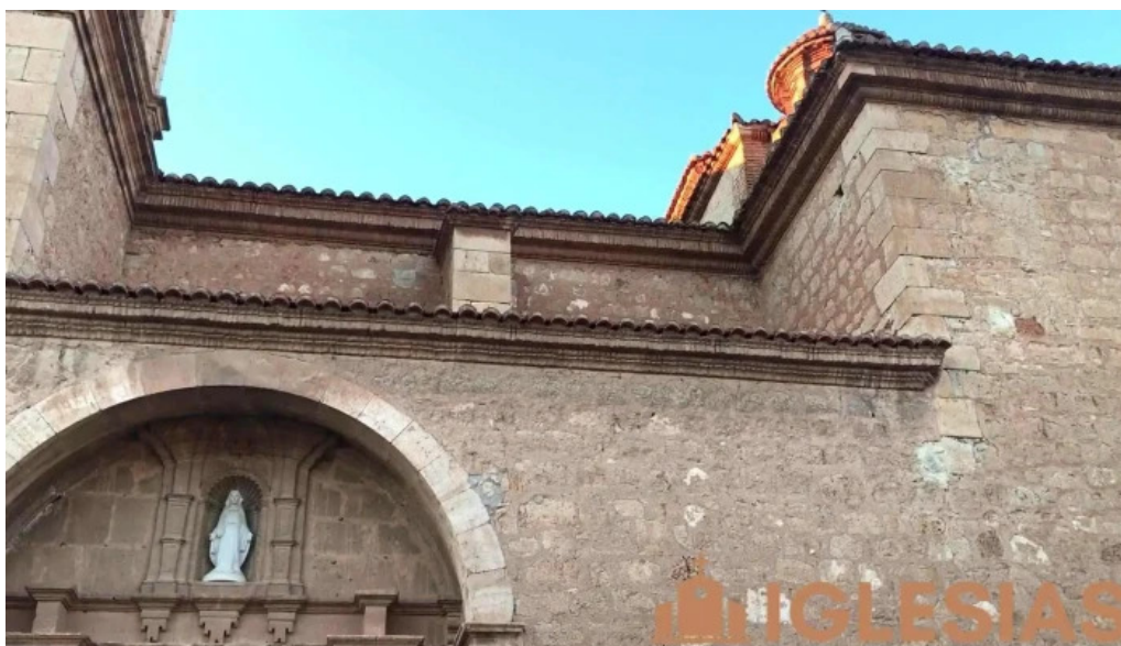
Iglesia parroquial de nuestra señora de la asuncion de villarquemado videos