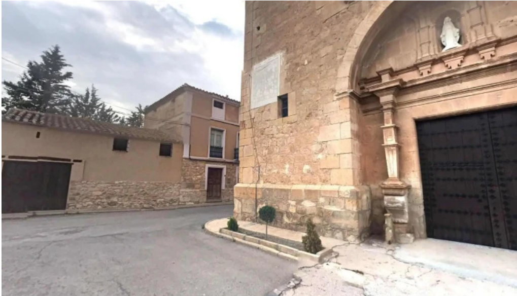
Iglesia parroquial de nuestra señora de la asuncion de villarquemado promocion