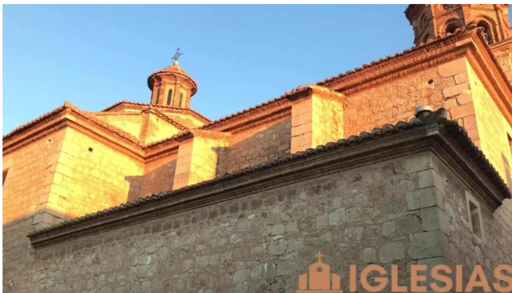
Iglesia parroquial de nuestra senora de la asuncion de villarquemado iglesia