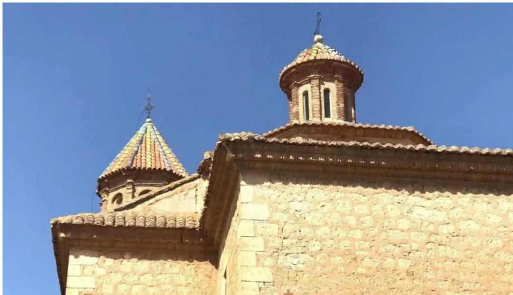
Iglesia parroquial de nuestra señora de la asuncion de villarquemado villarquemado