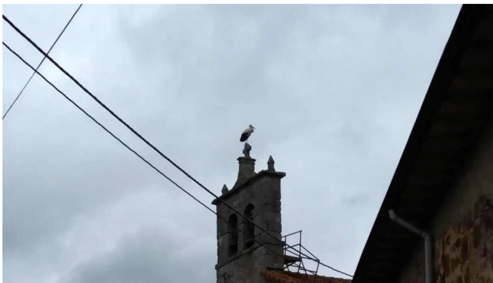
Iglesia de san millan descuentos