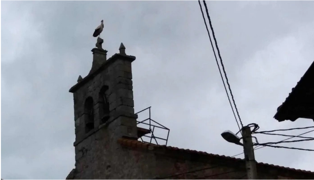
Iglesia de san millan instagram