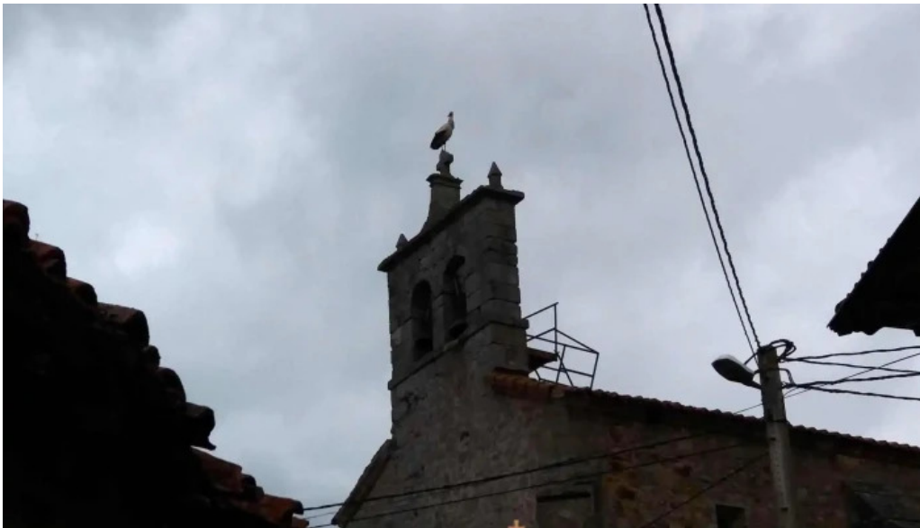
Iglesia de san millan iglesia