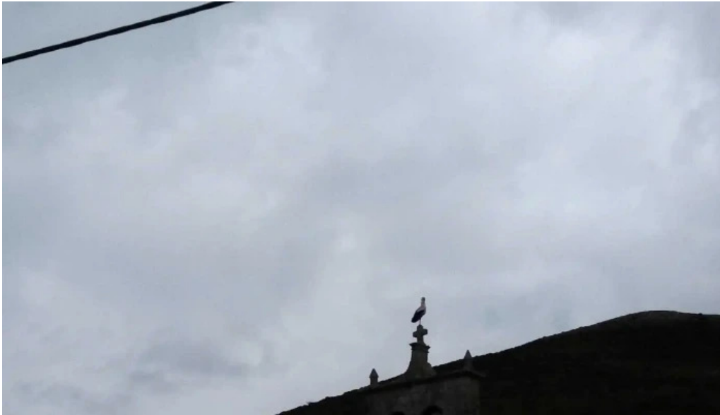
Iglesia de san millan villapaderne