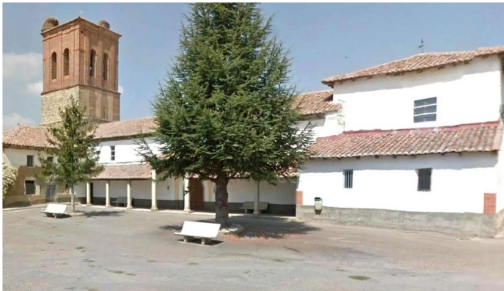
Iglesia de san juan degollado villanueva de las manzanas