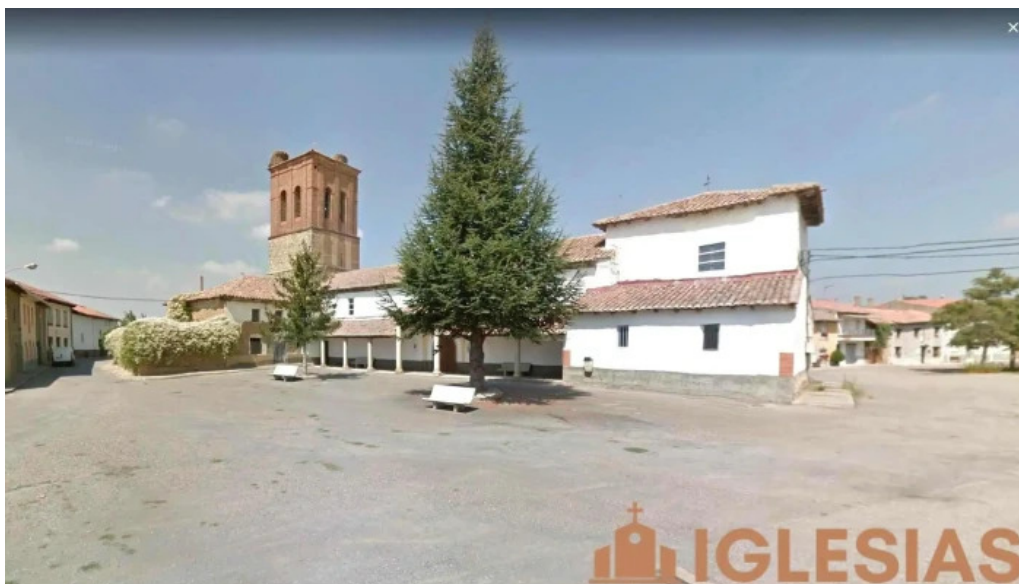
Iglesia de san juan degollado iglesia