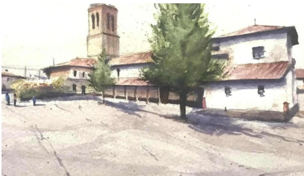
Iglesia de san juan degollado fotos