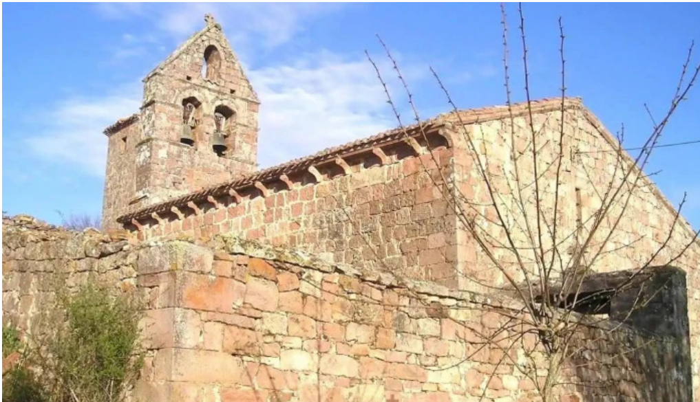
Iglesia de la asuncion villanueva de la torre