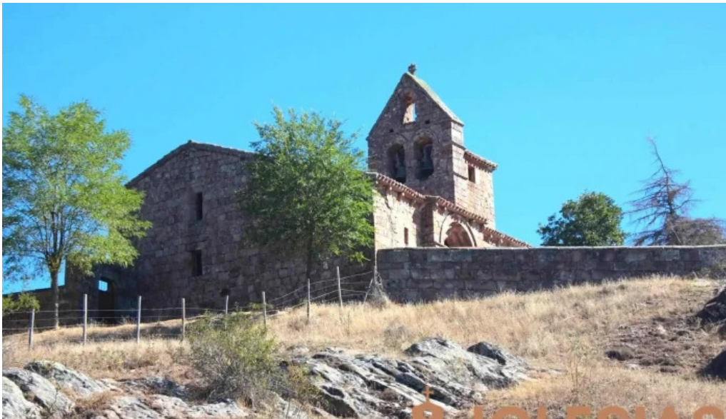
Iglesia de la asuncion iglesia