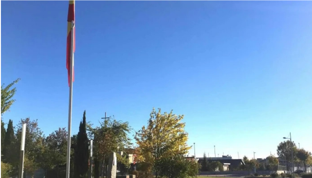
Ermita y cementerio del cristo promocion