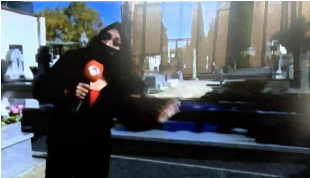
Ermita y cementerio del cristo donde