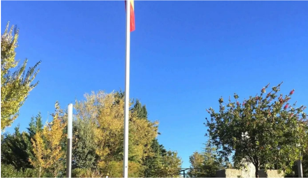
Ermita y cementerio del cristo villanueva de la canada