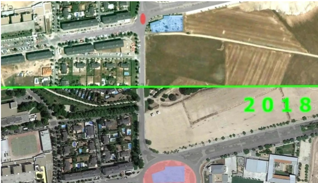
Ermita y cementerio del cristo ubicacion