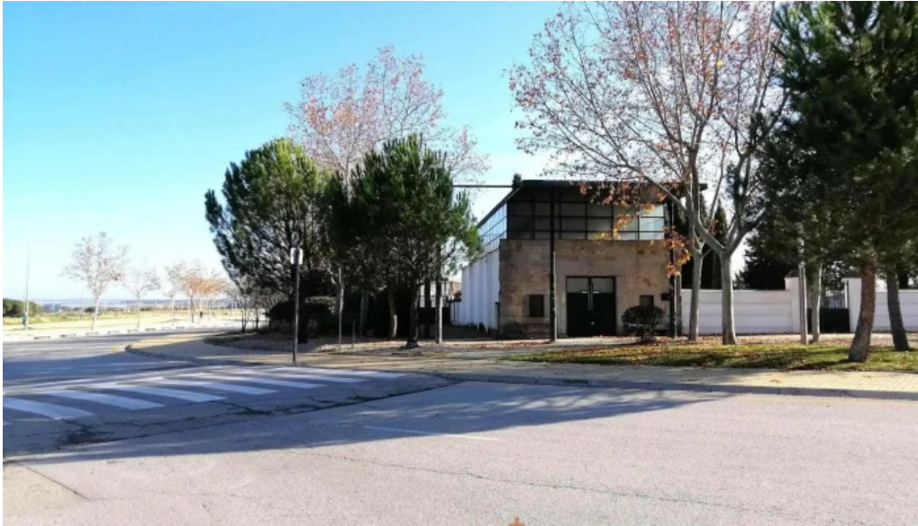
Ermita y cementerio del cristo iglesia