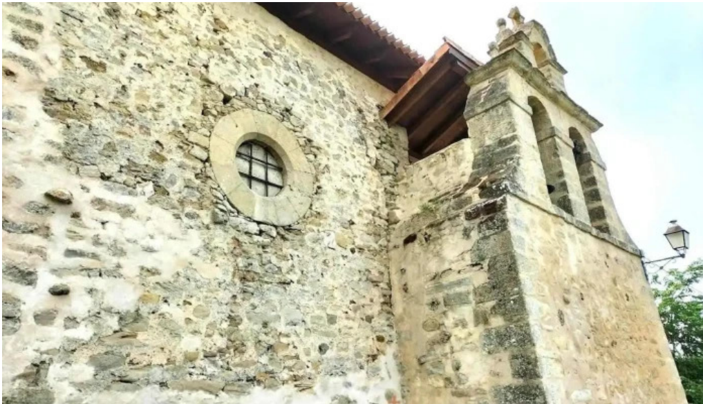
Iglesia de san andres villambrosa