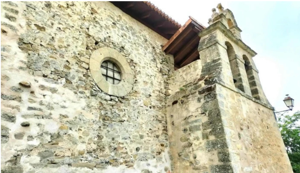
Iglesia de san andres iglesia