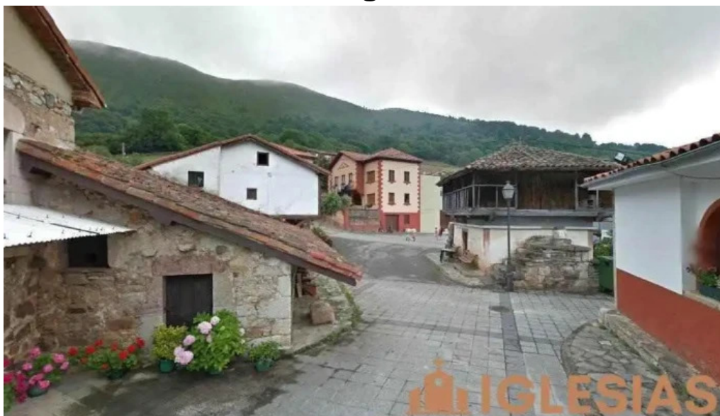
Iglesia de santa maria de tameza villabre