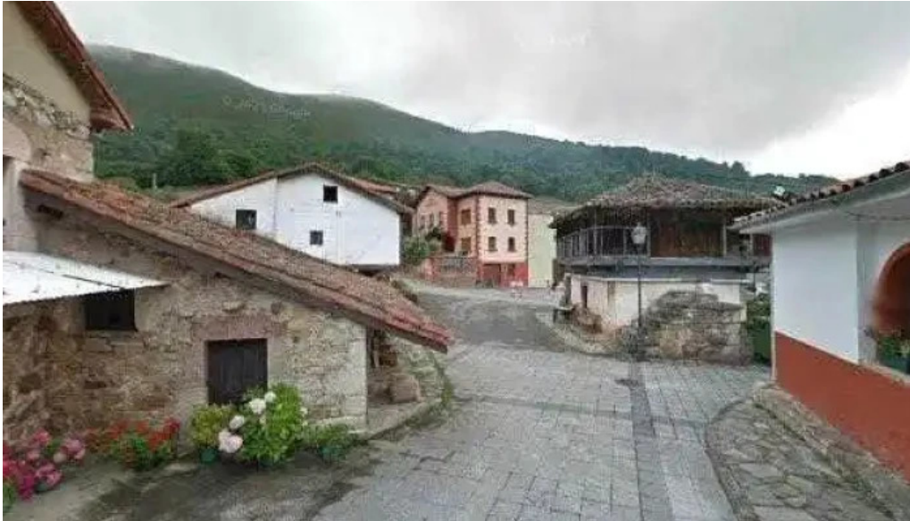
Iglesia de santa maria de tameza iglesia