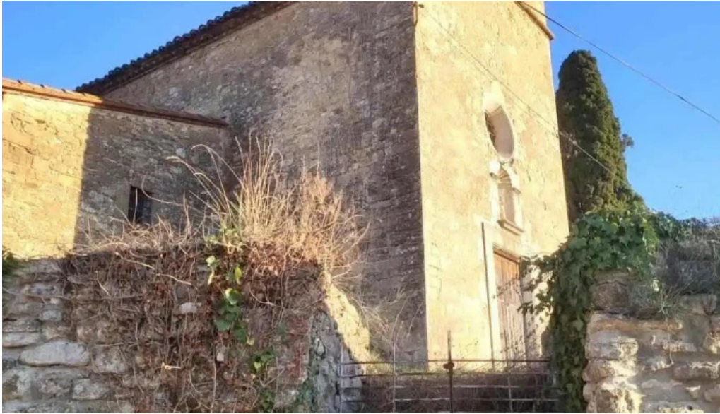
Iglesia de sant esteve de vilademi vilademuls