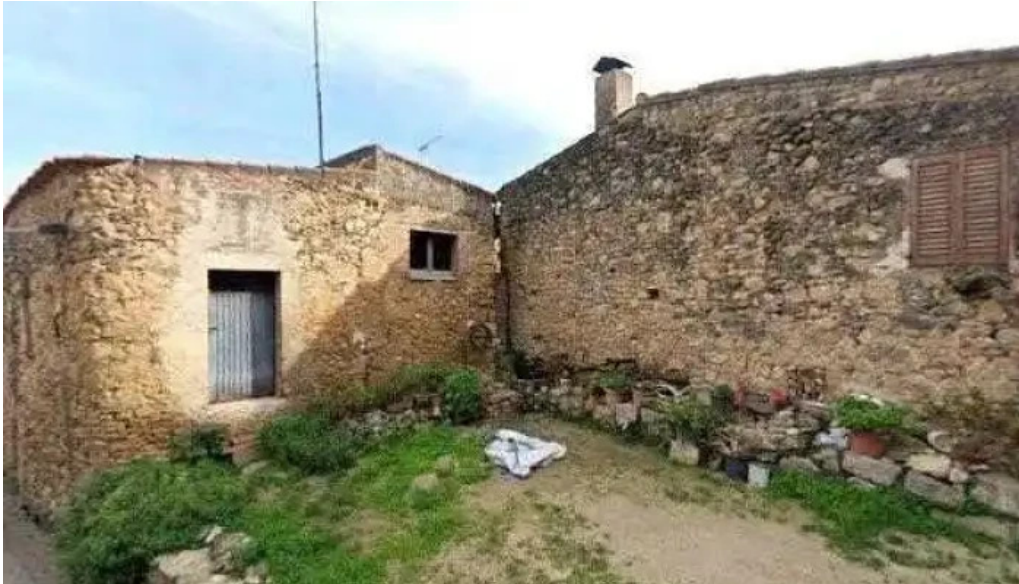
Iglesia de san juan bautista zona