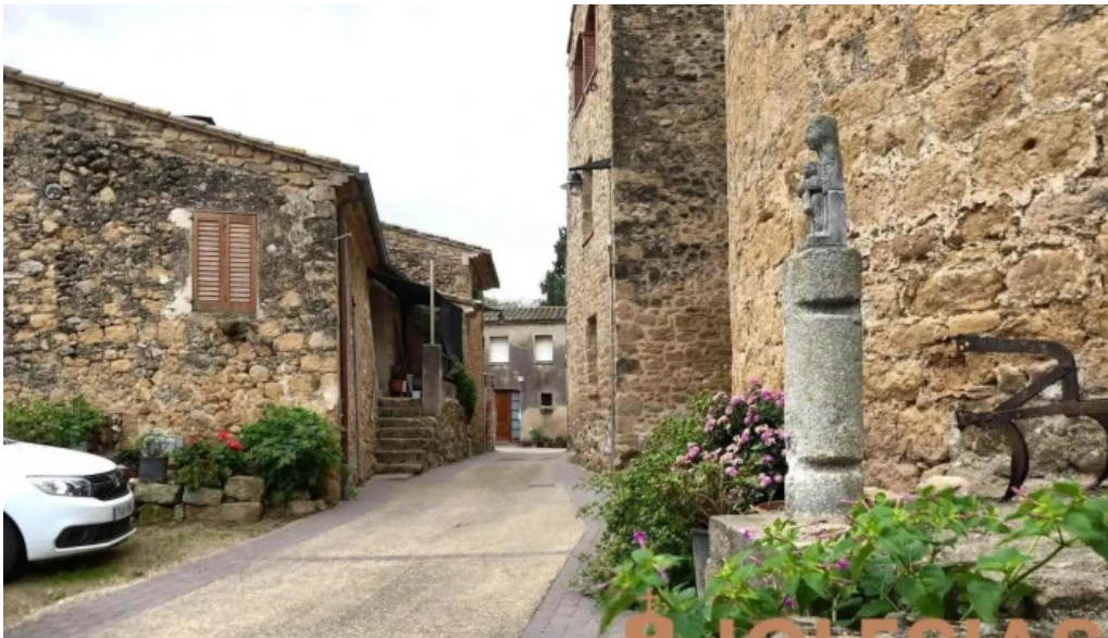
Iglesia de san juan bautista vilademuls