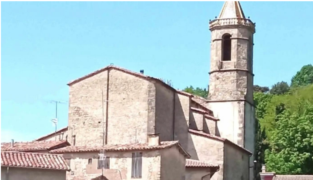
Iglesia de sant hilari de vidra vidra