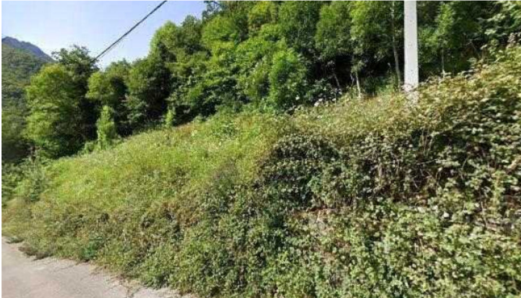
Ermita de viboli iglesia