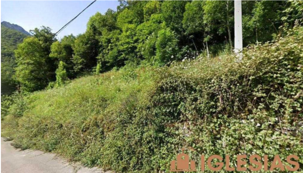
Ermite de viboli viboli