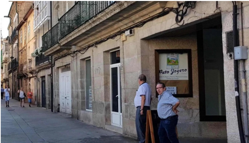
Iglesia de santa maria a maior de verin precios