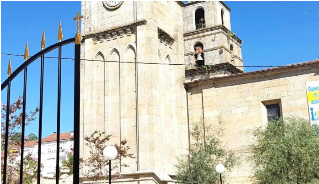
Iglesia de santa maria a maior de verin horario