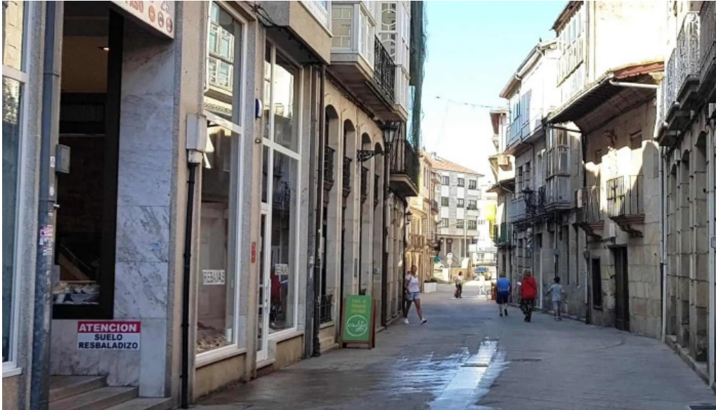
Iglesia de santa maria a maior de verin promocion