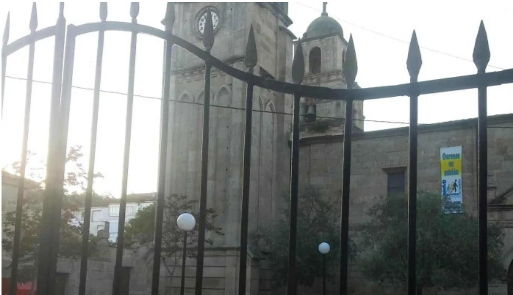
Iglesia de santa maria a maior de verin puntaje