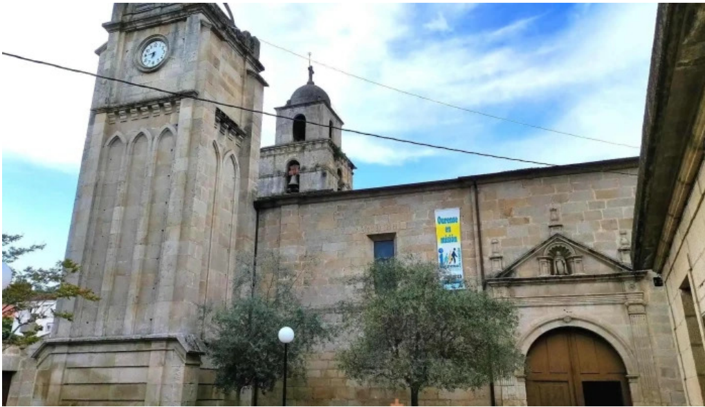
Iglesia de santa maria a maior de verin iglesia