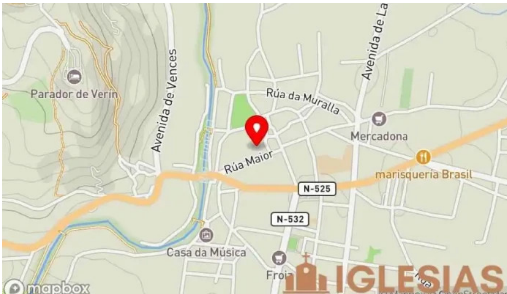
Iglesia de santa maria a maior de verin mapa