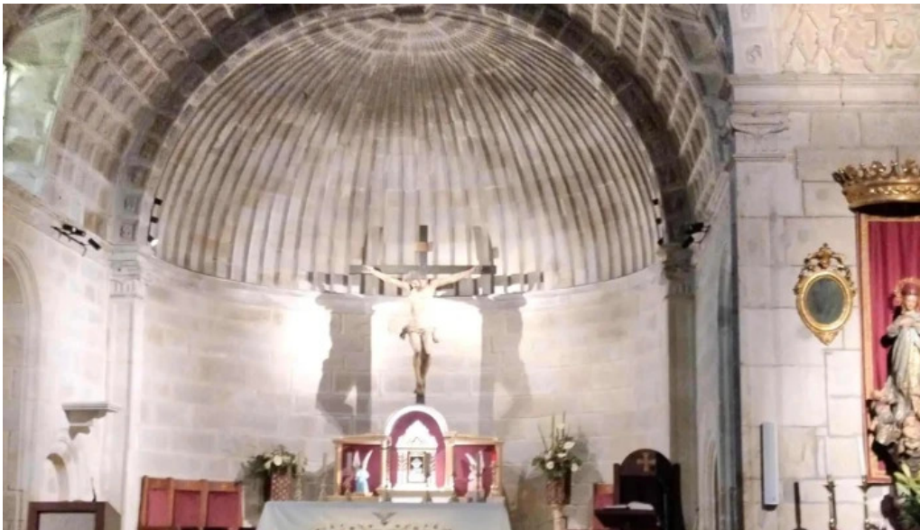
Iglesia de santa maria a maior de verin cerca de mi