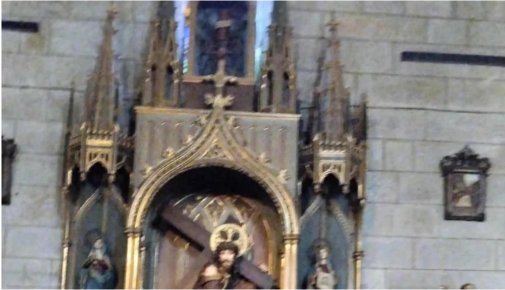
Iglesia de santa maria a maior de verin direccion