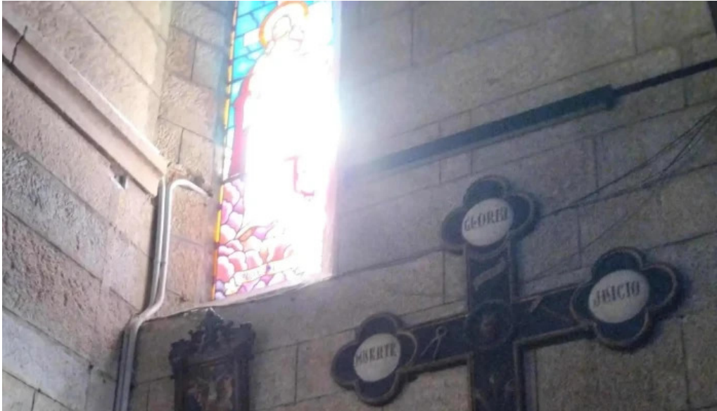
Iglesia de santa maria a maior de verin opiniones