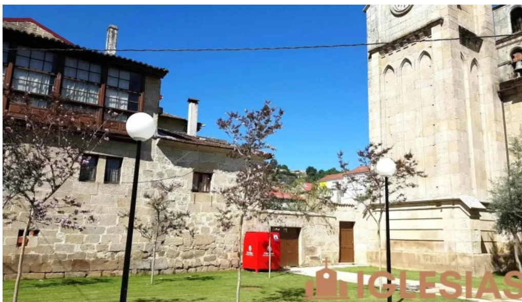
Iglesia de santa maria a maior de verin videos