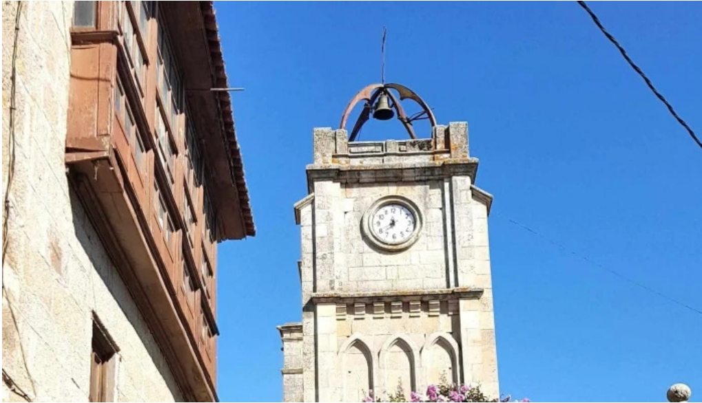
Iglesia de santa maria a maior de verin verin