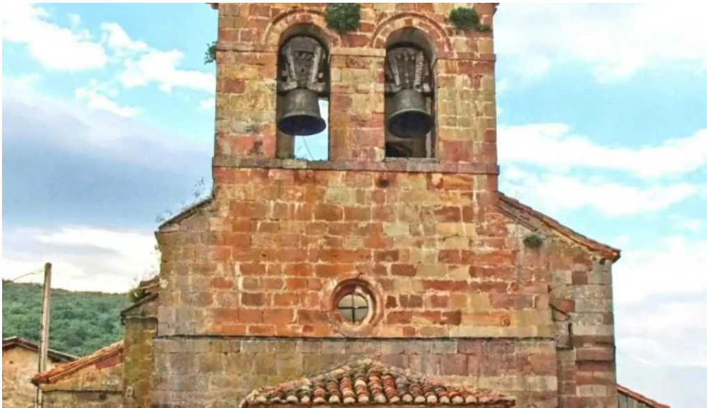
Iglesia de san pedro apostol iglesia