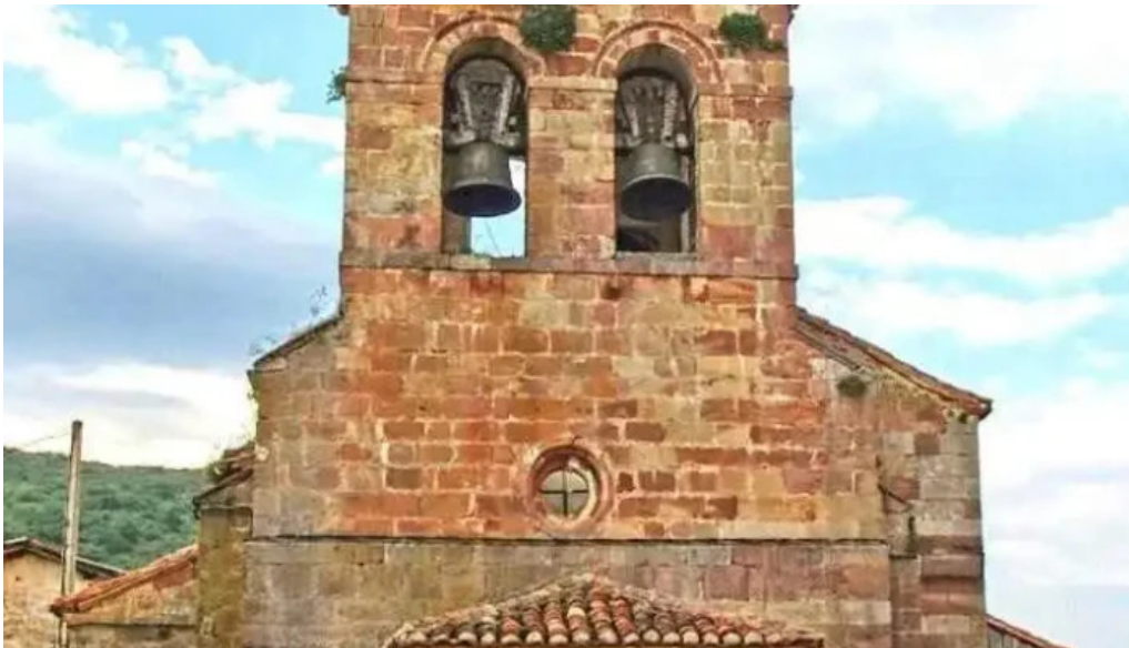
Iglesia de san pedro apostol vergano