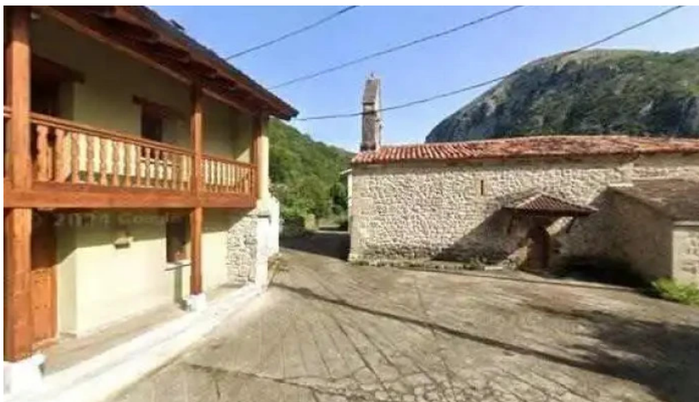
Iglesia de san pablo iglesia