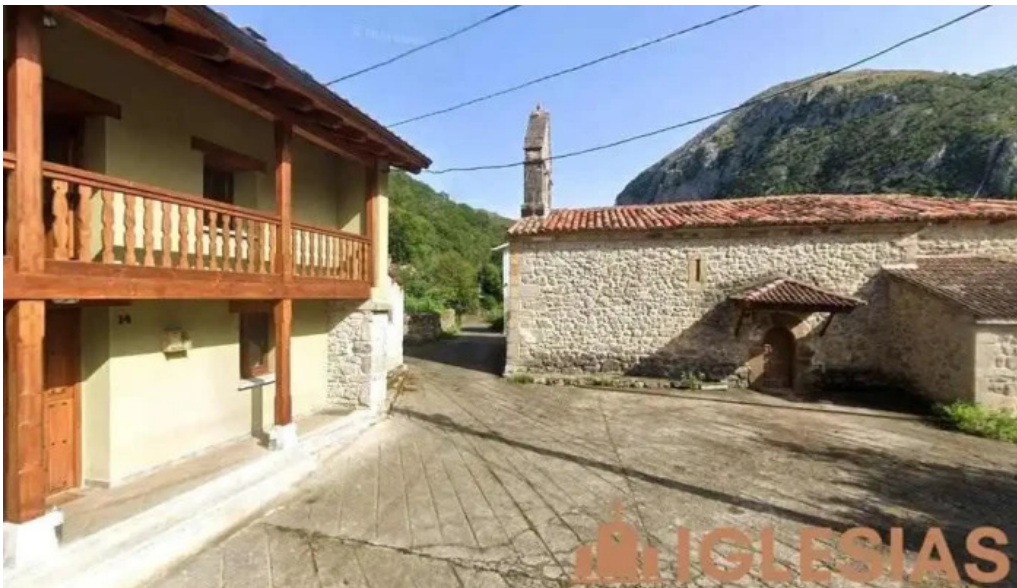
Iglesia de san pablo vega de cien