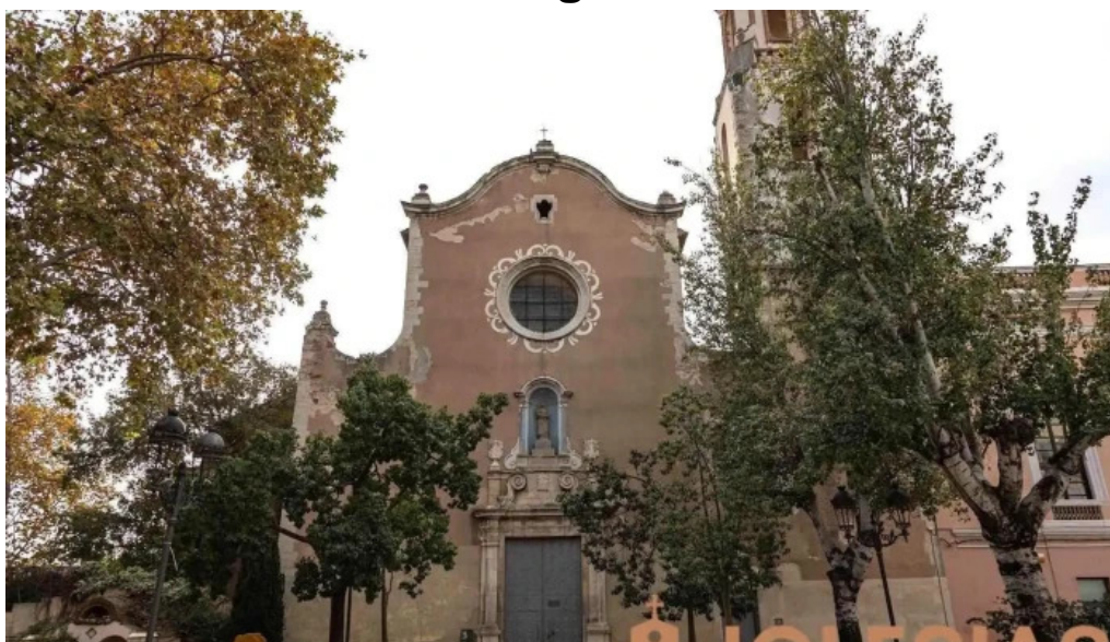
Esglesia del carme valls