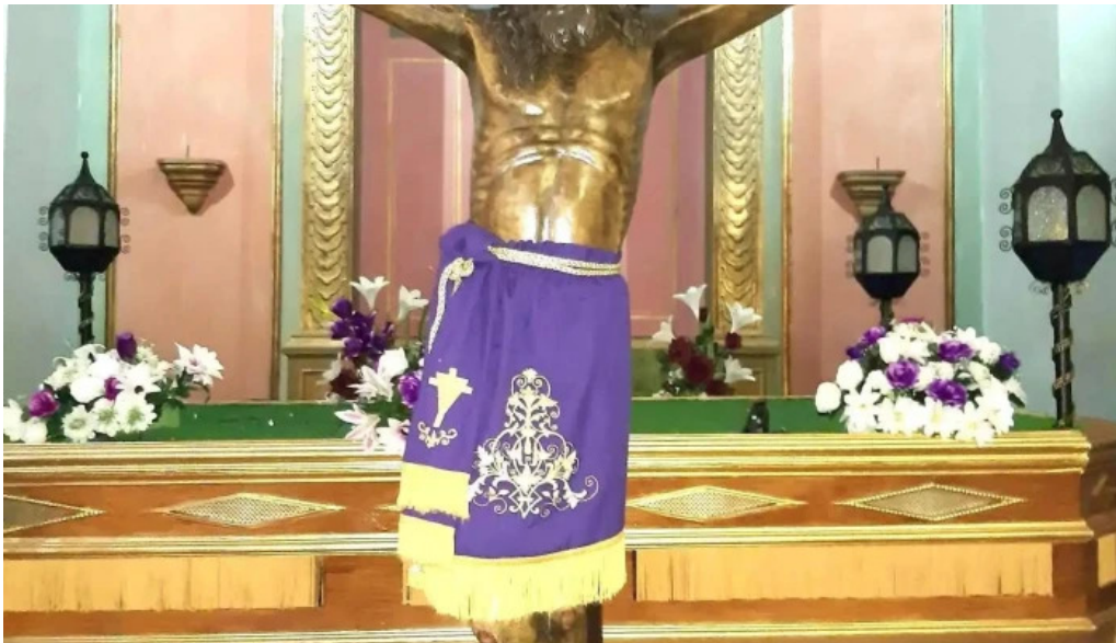
Esglesia del carme iglesia