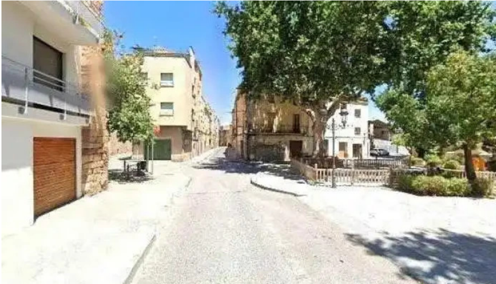
Esglesia del carme instagram