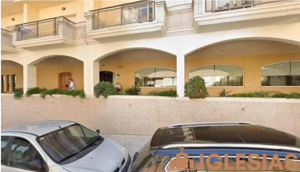
Esglesia carmelites missioneres teresianes valls