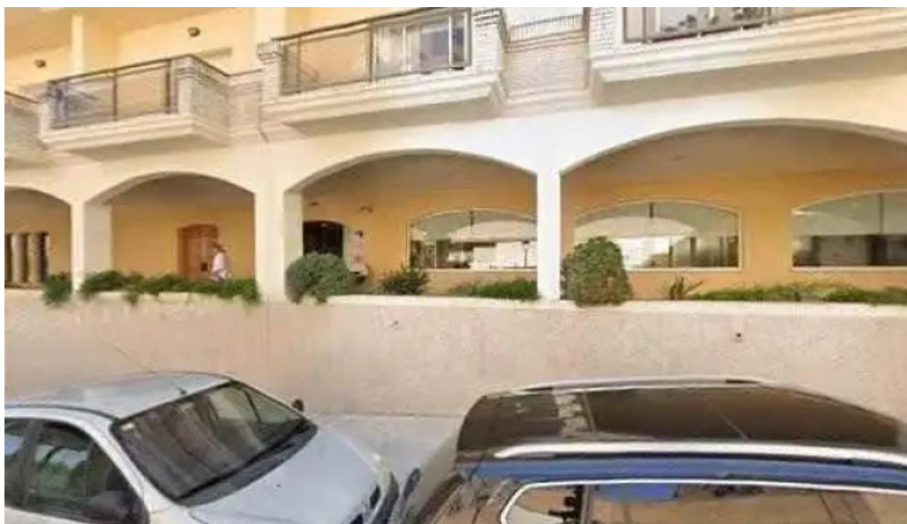
Esglesia carmelites misioneres teresianes iglesia