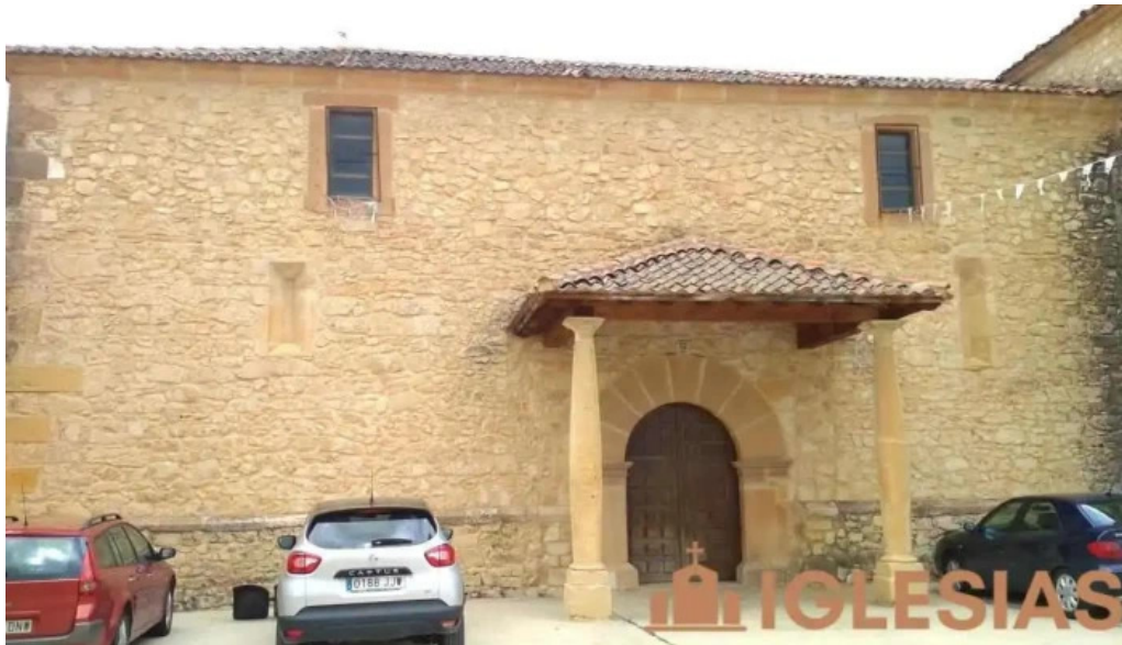
Iglesia de valleruela de sepulveda valleruela de sepulveda