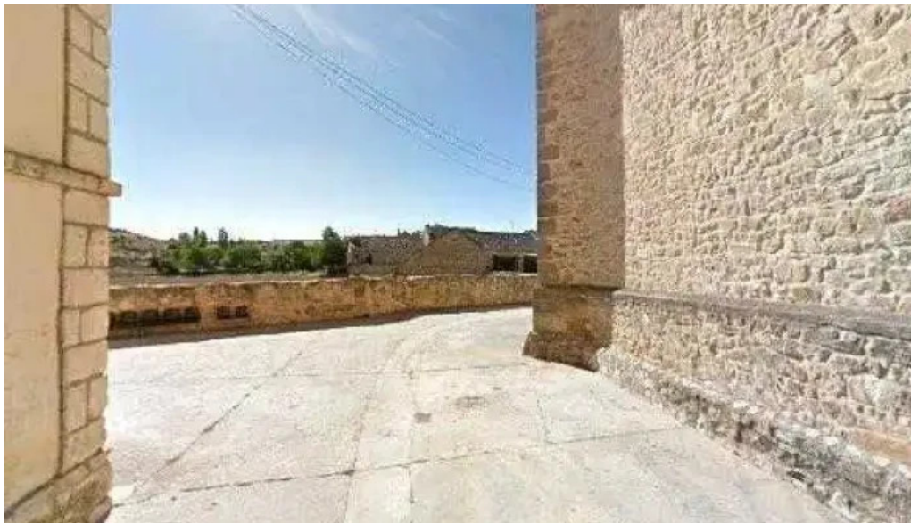
Iglesia de valleruela de sepulveda telefono