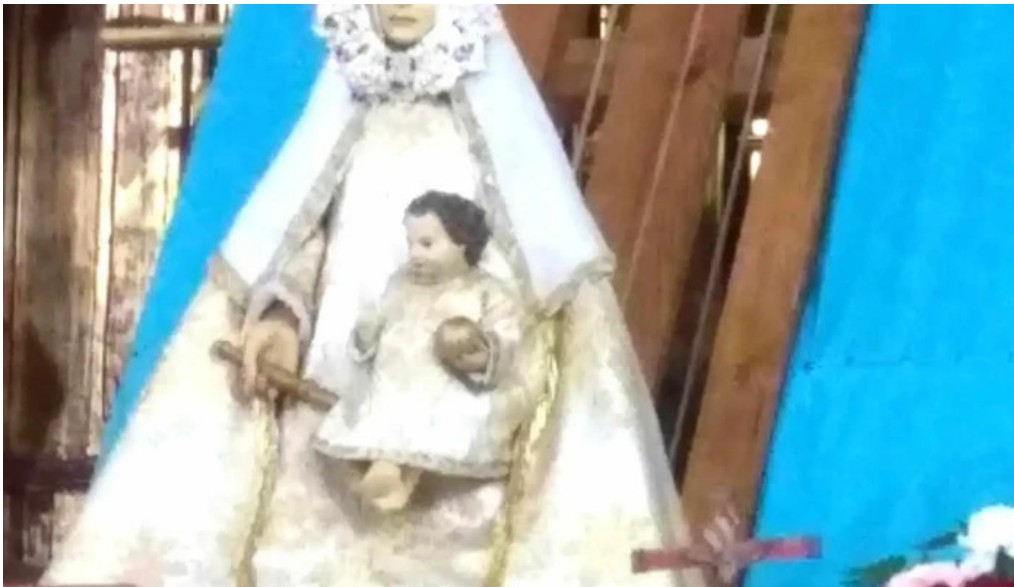
Iglesia de valleruela de sepulveda iglesia