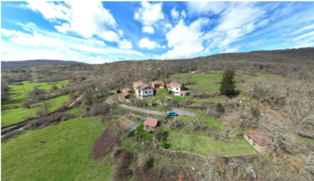
Iglesia de san bartolome iglesia