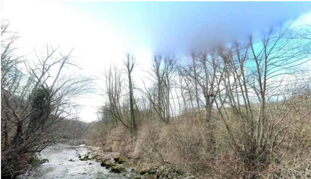
Iglesia de san bartolome precios