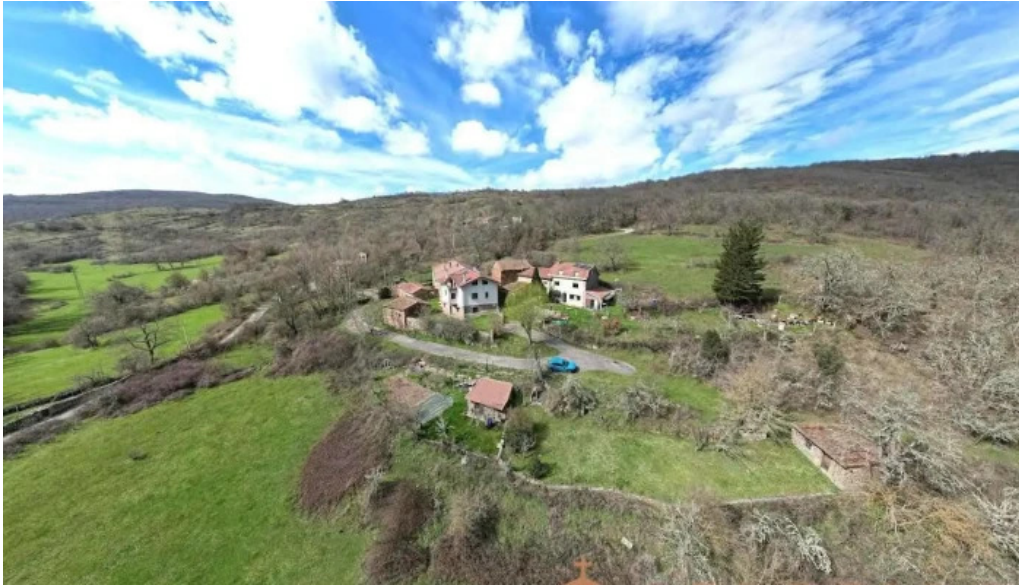
Iglesia de san bartolome valdeprado del rio