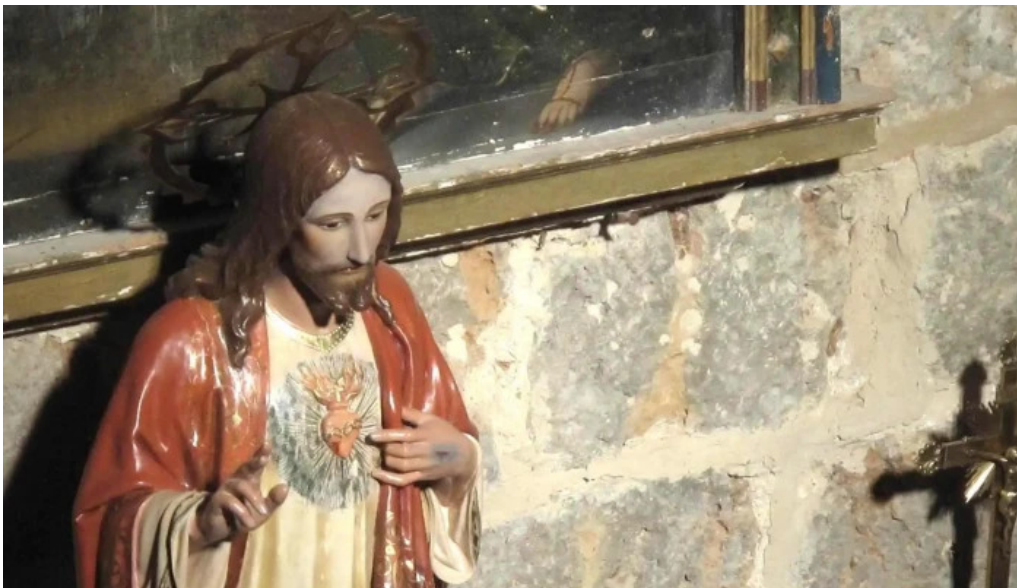
Iglesia de san vicente martir valdenebro de los valles