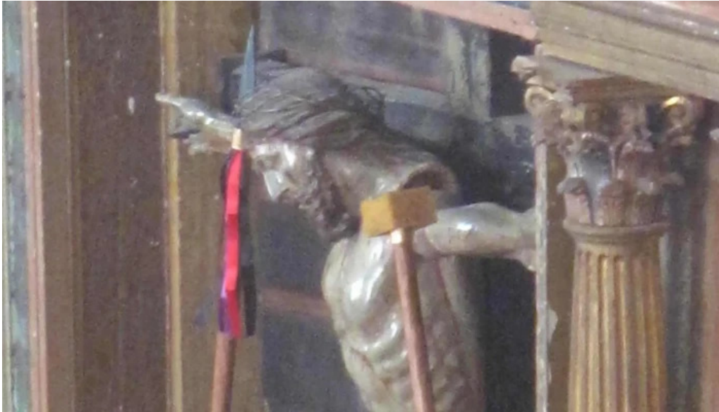
Iglesia de san vicente martir promocion