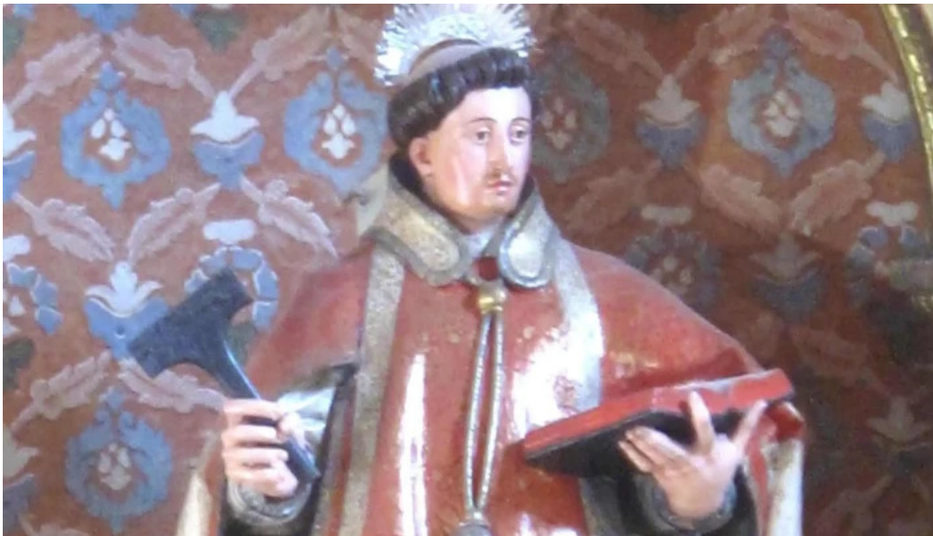
Iglesia de san vicente martir donde