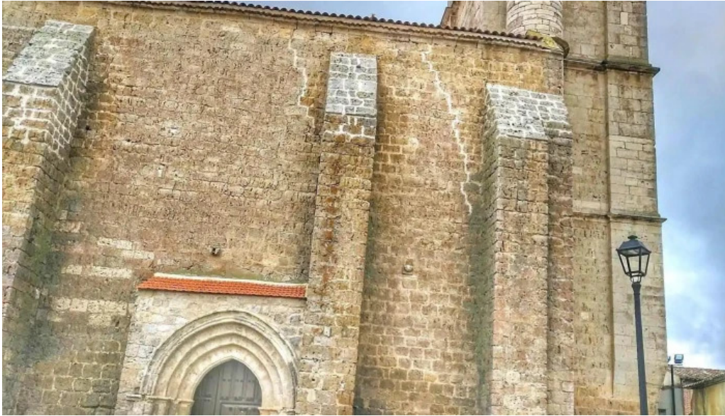
Iglesia de san vicente martir iglesia