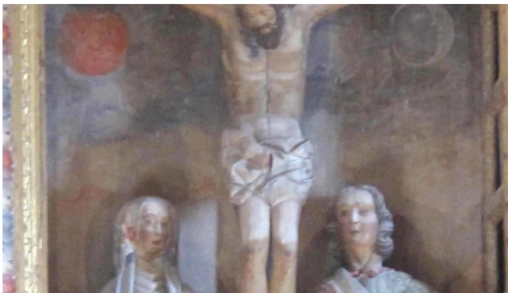
Iglesia de san vicente martir catalogo