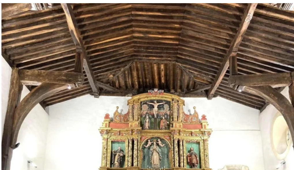
Lemoizko andra mari eliza iglesia de santa maria abierto ahora