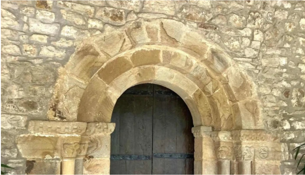
Lemoizko andra mari eliza iglesia de santa maria urizar