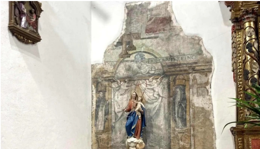
Lemoizko andra mari eliza iglesia de santa maria ubicacion