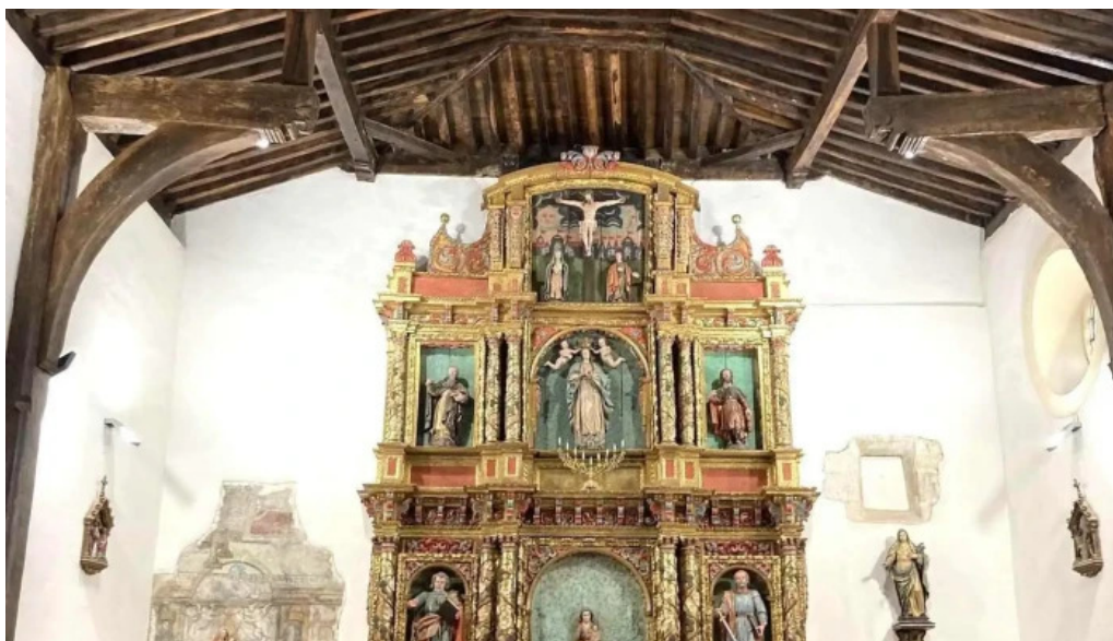
Lemoizko andra mari eliza iglesia de santa maria iglesia