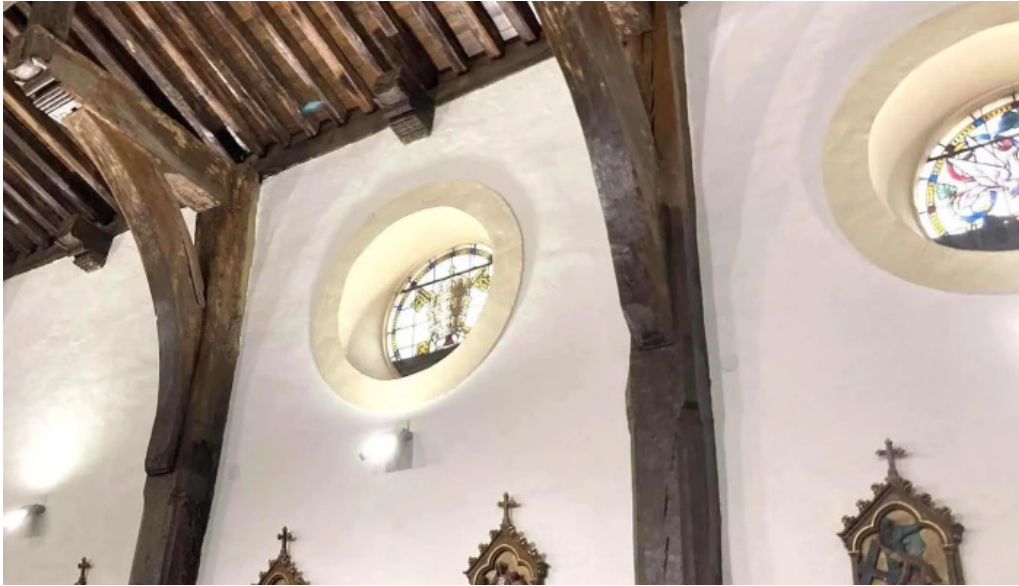
Lemoizko andra mari eliza iglesia de santa maria telefono