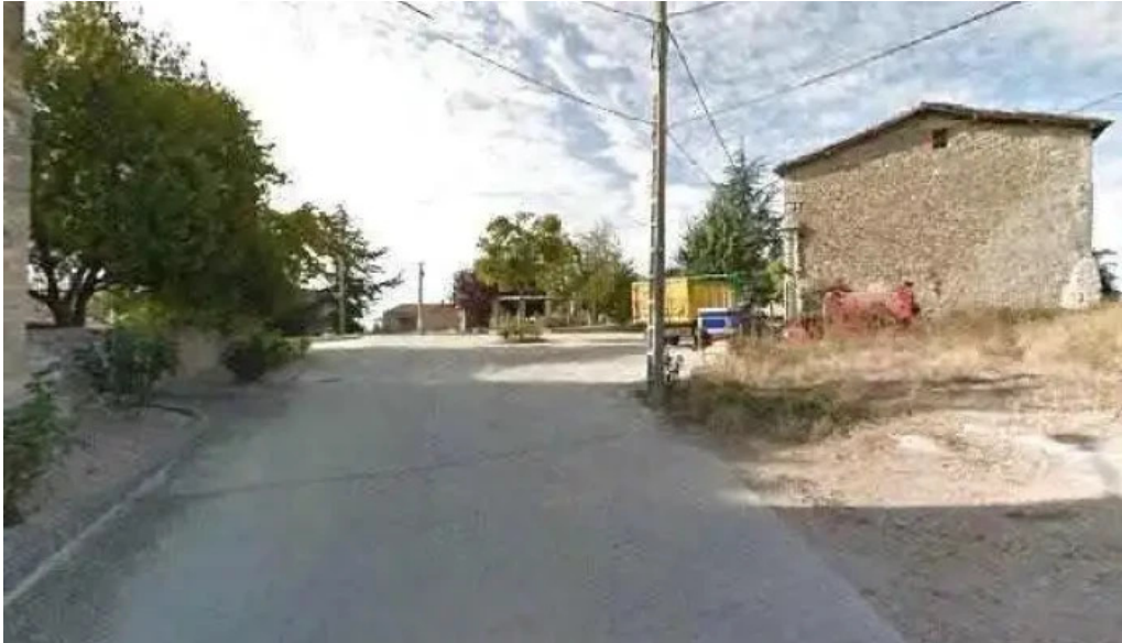
Mattin deunaren elizaiglesia de san martin fotos