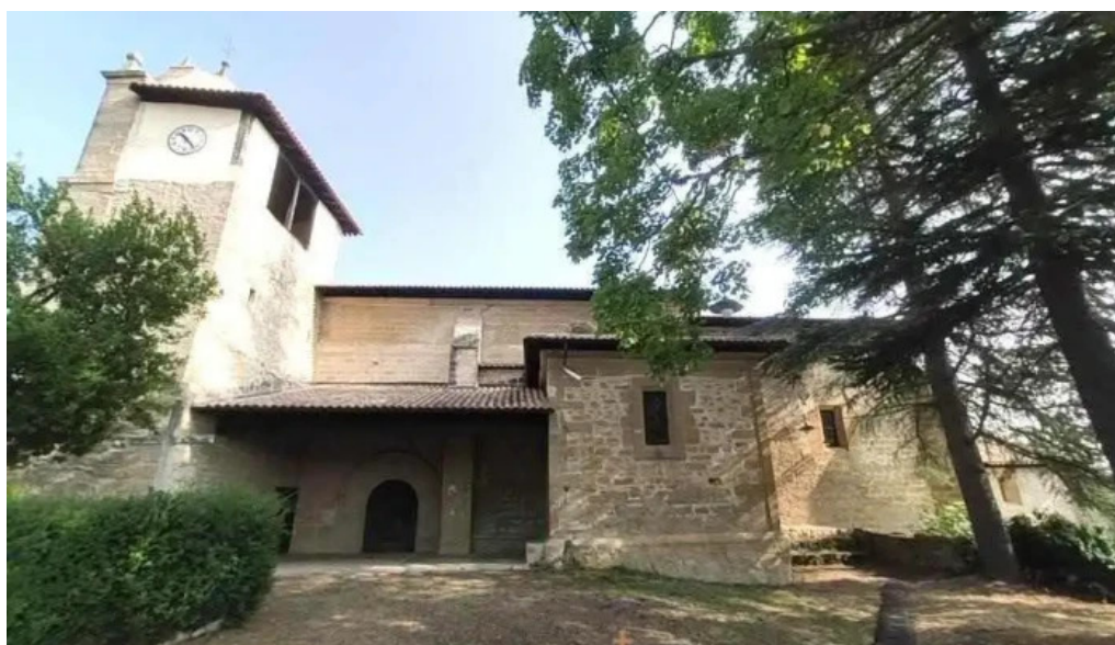
Mattin deunaren elizaiglesia de san martin iglesia