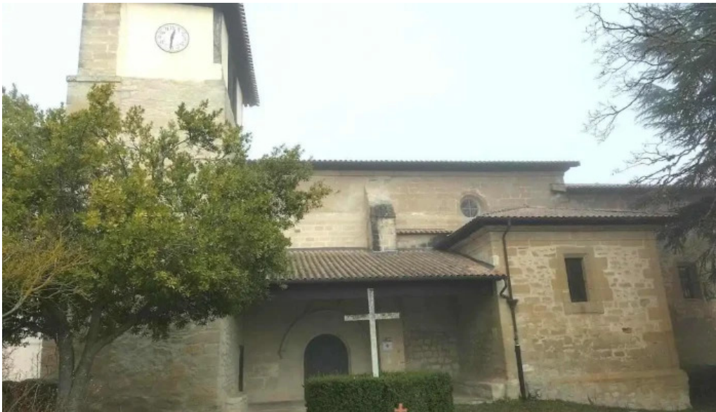
Mattin deunaren eliza iglesia de san martin turiso