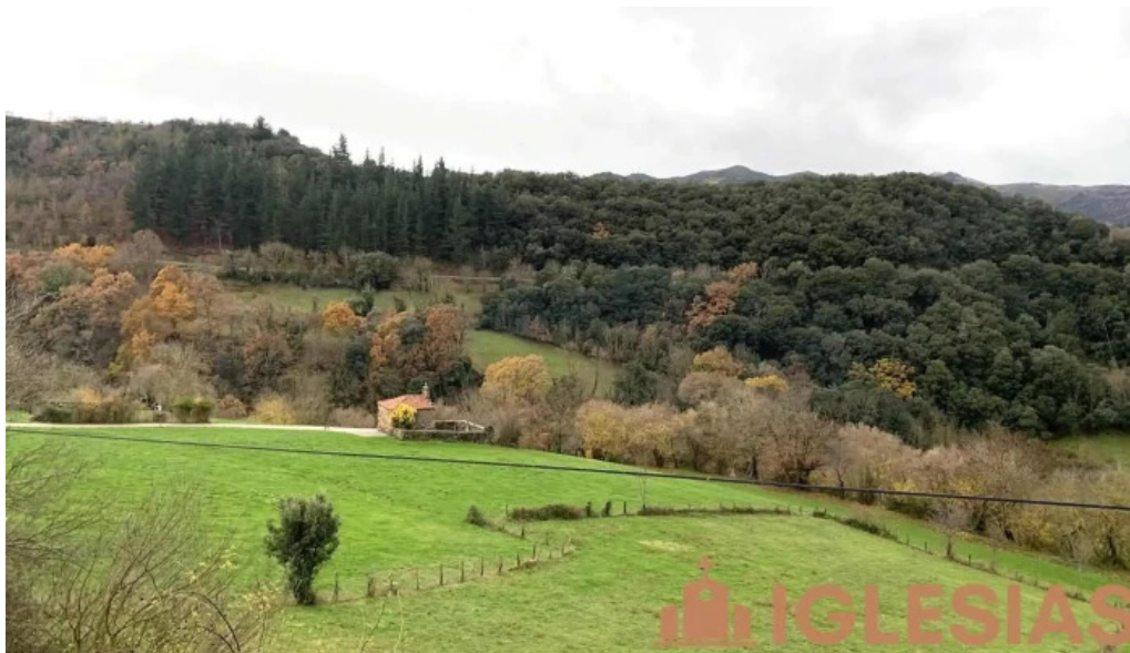
Iglesia de nuestra senora de la o iglesia