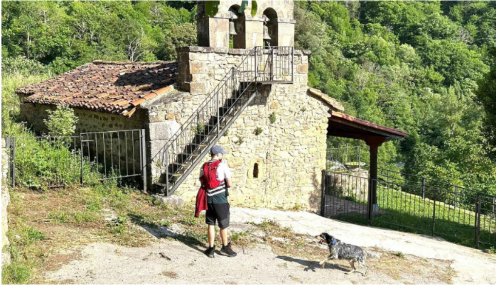
Iglesia de nuestra senora de la o trillayo