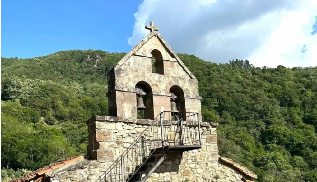
Iglesia de nuestra senora de la o como llegar