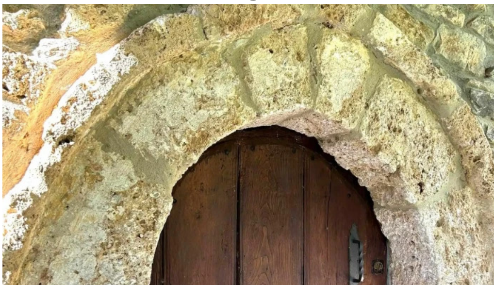
Iglesia de nuestra senora de la o ubicacion