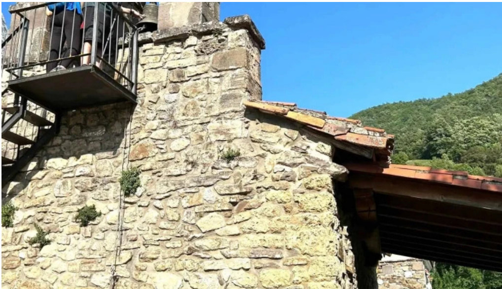
Iglesia de nuestra senora de la o promocion