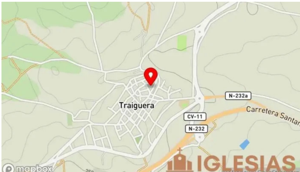
Parroquia de la asuncion de maria mapa