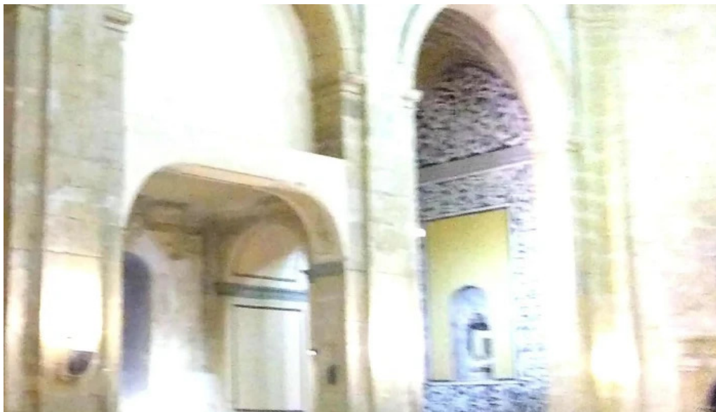
Parroquia de la asuncion de maria videos