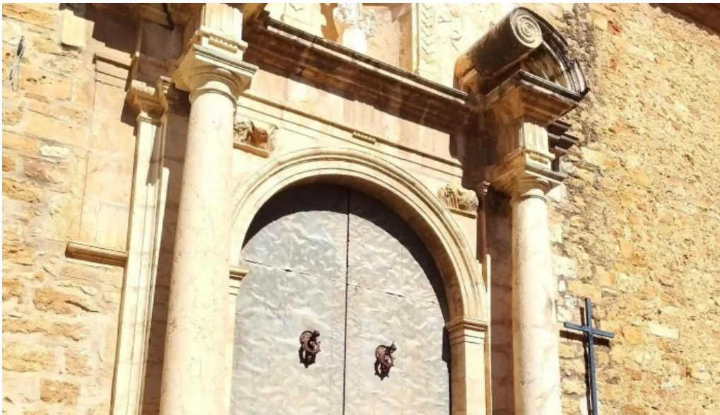
Parroquia de la asuncion de maria opiniones