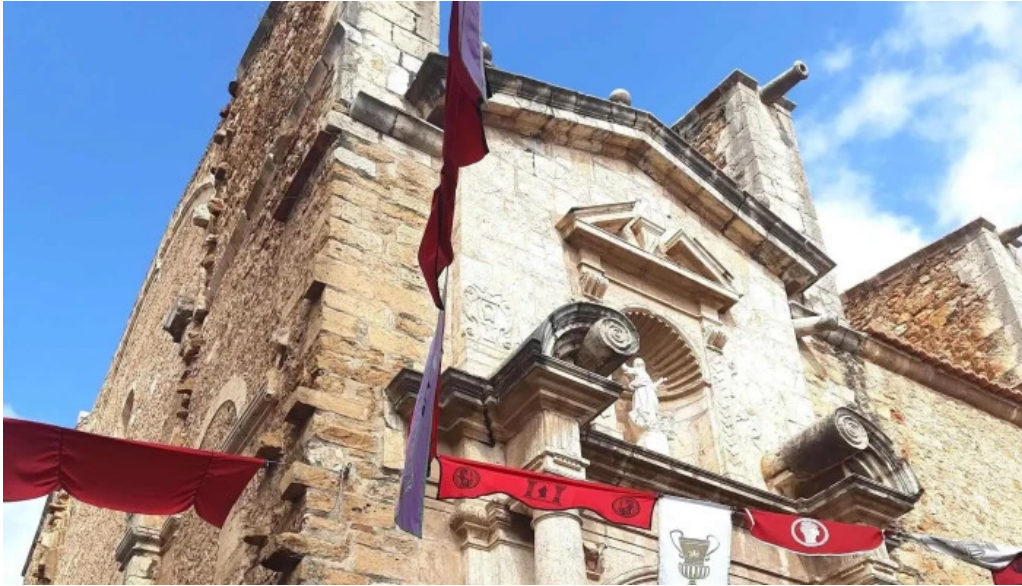
Parroquia de la asuncion de maria telefono