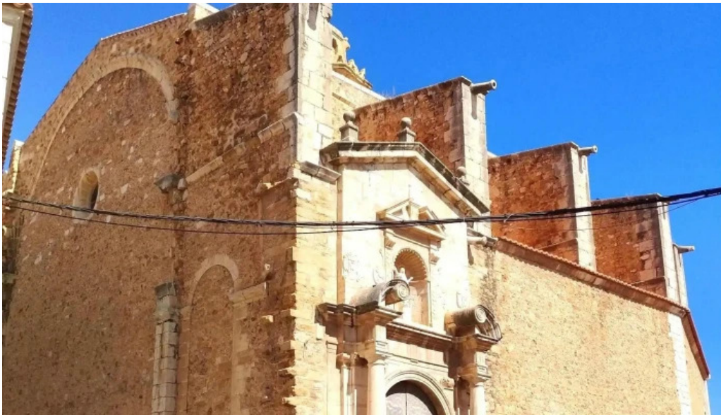
Parroquia de la asuncion de maria sitio web