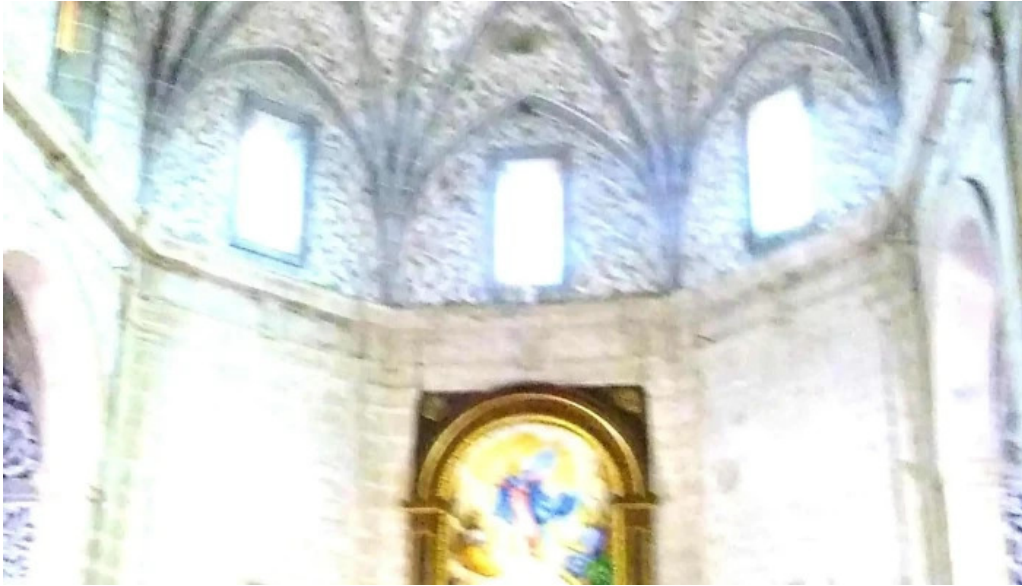
Parroquia de la asuncion de maria direccion