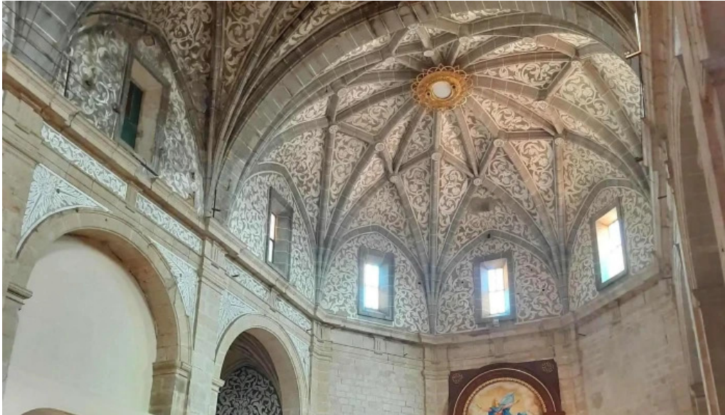
Parroquia de la asuncion de maria ubicacion