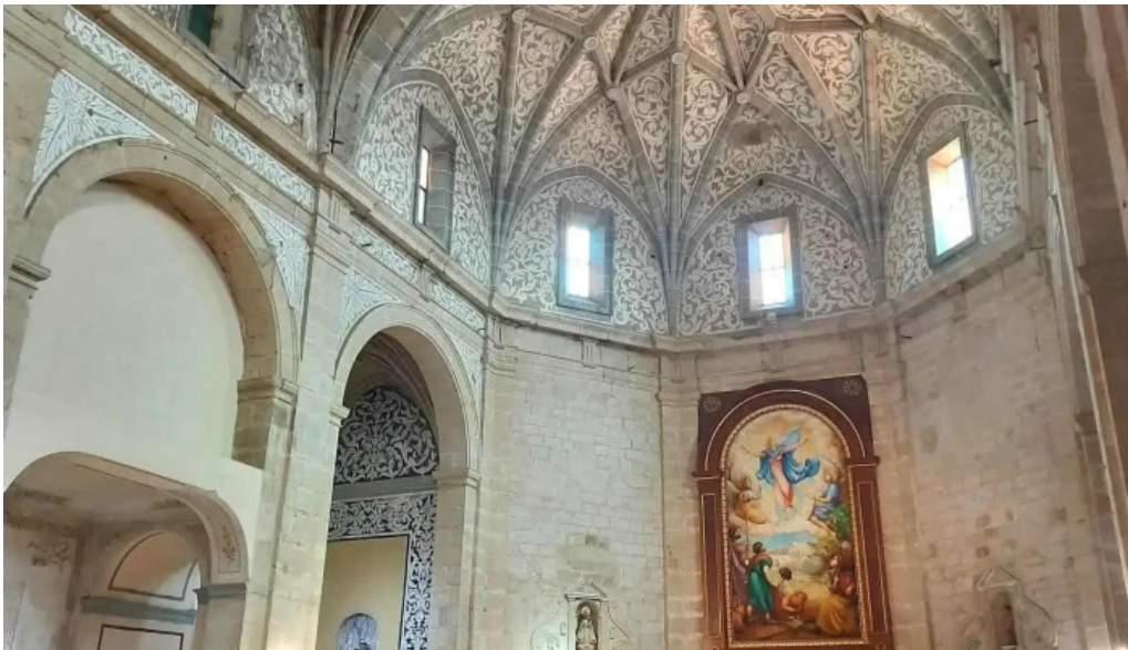
Parroquia de la asuncion de maria iglesia