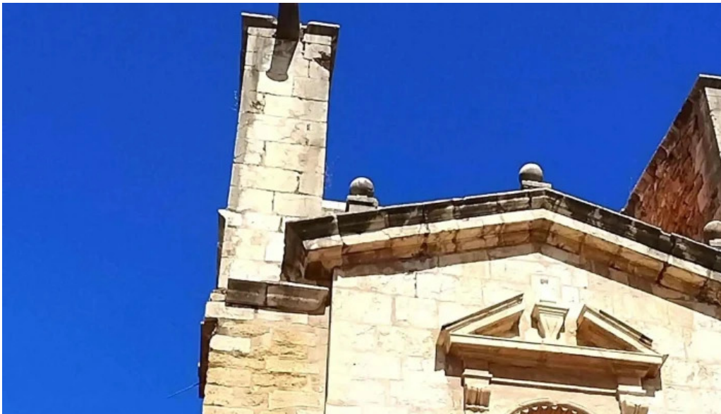
Parroquia de la asuncion de maria descuentos