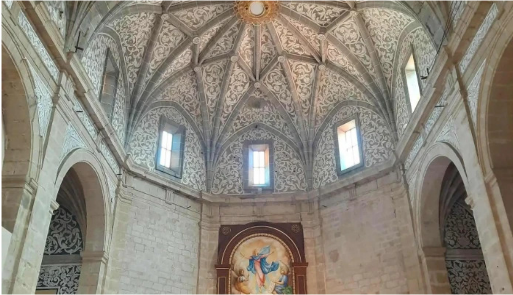
Parroquia de la asuncion de maria puntaje