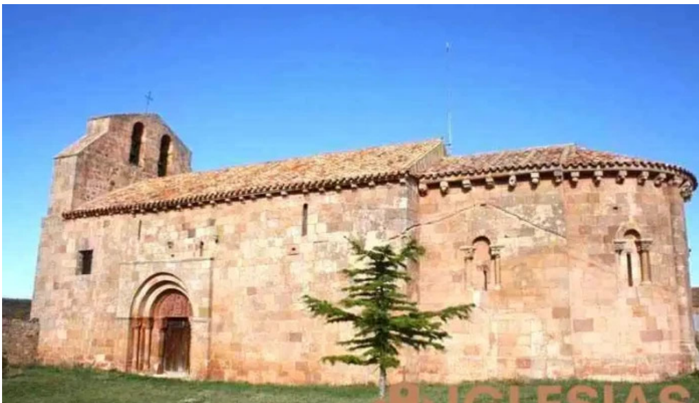
Iglesia de san juan bautista tozalmoro