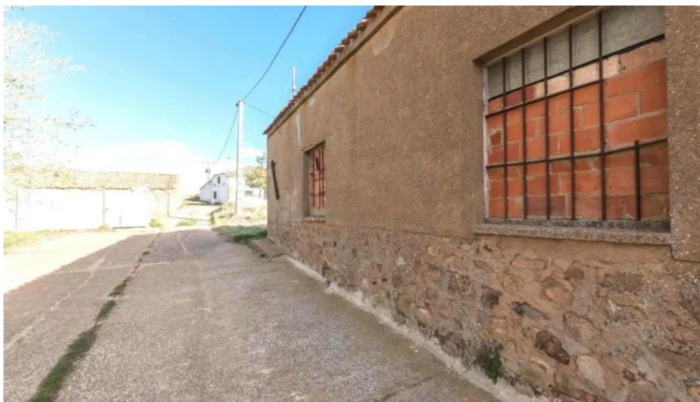
Iglesia de san juan bautista como llegar