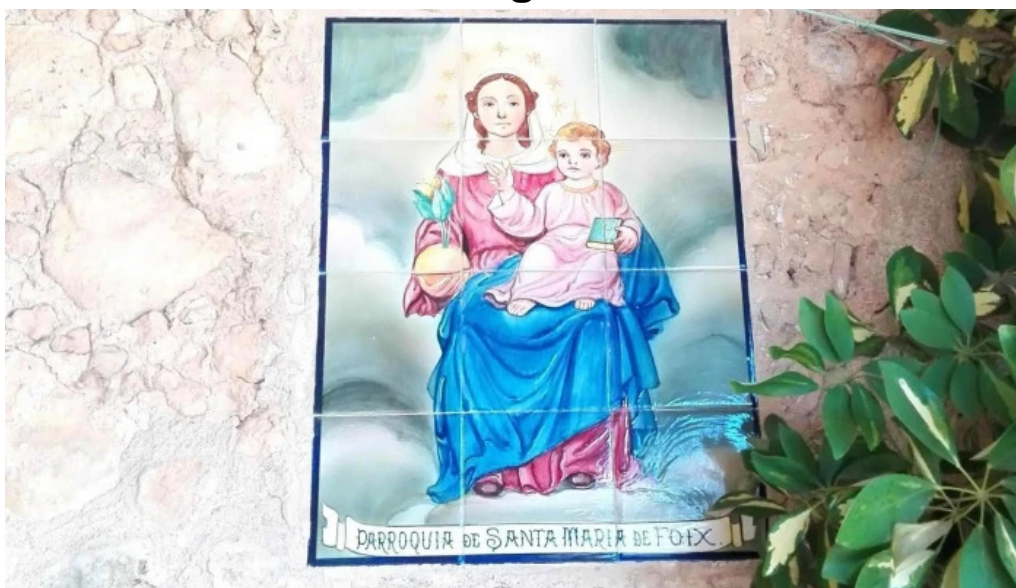
Santa maria de torrelles de foix torrelles de foix