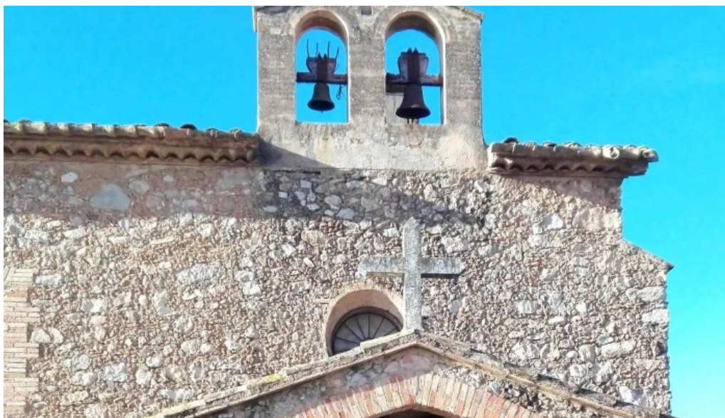
Santa maria de torrelles de foix instagram