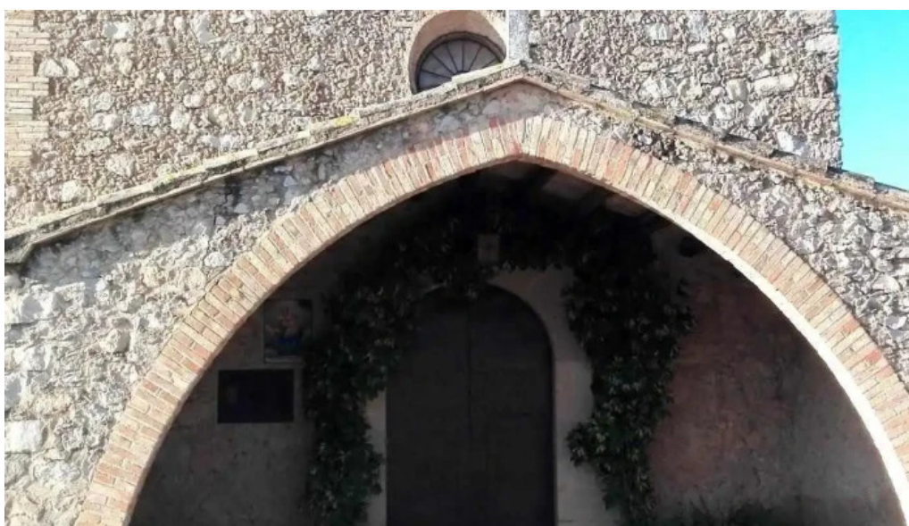
Santa maria de torrelles de foix iglesia