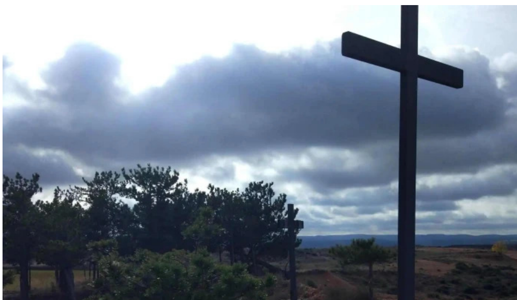
Ermita de s pascual y virgen de la sierra torrehermosa