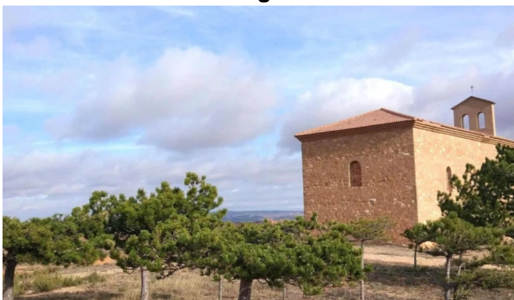
Ermita de s pascual y virgen de la sierra viejos