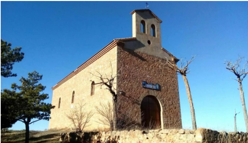
Ermita de s pascual y virgen de la sierra iglesia