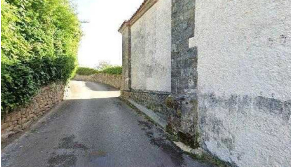
Iglesia de san tirso comentarios