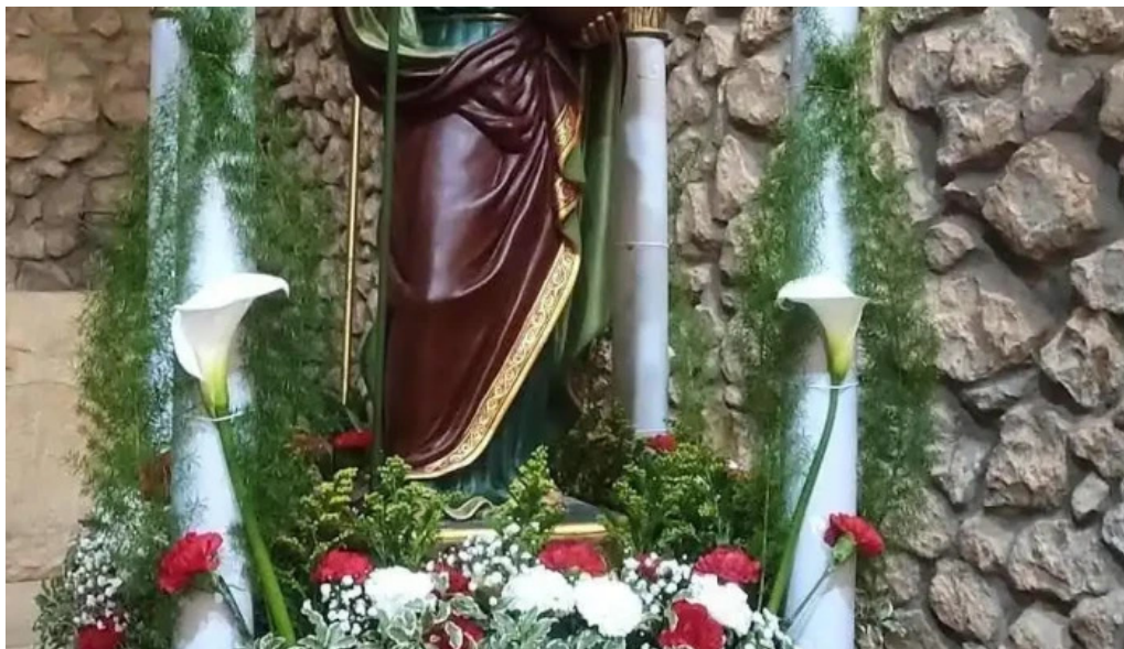
Iglesia de san tirso iglesia