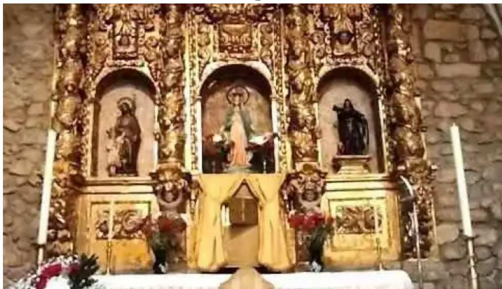
Iglesia de san tirso tonanes