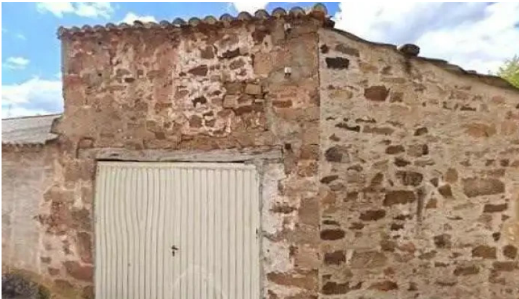
Iglesia de nuestra senora del carmen comentarios