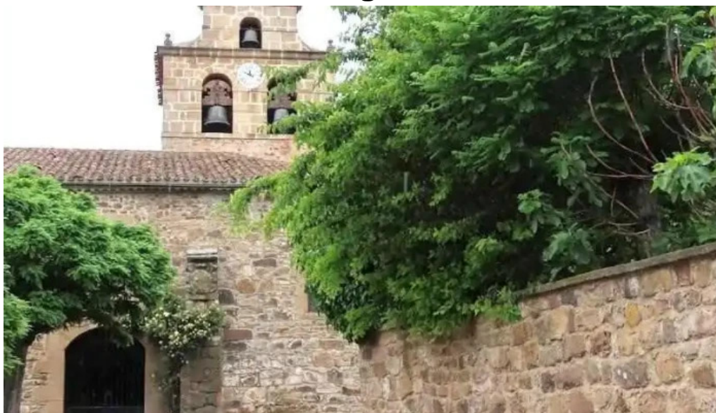
Iglesia de nuestra senora del carmen tera