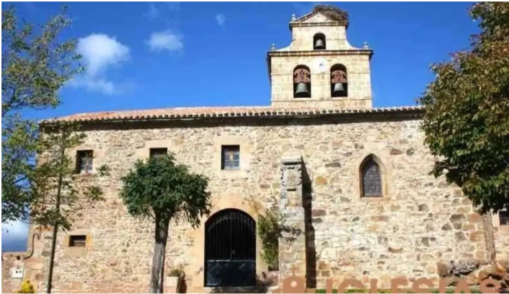
Iglesia de nuestra senora del carmen iglesia