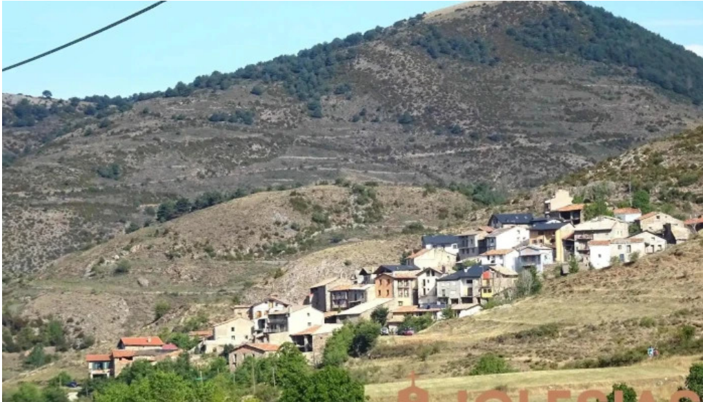
Sant julia de taus iglesia