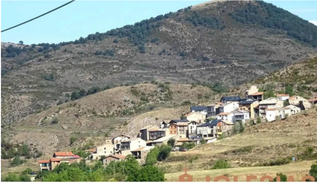
Sant julia de taus taus